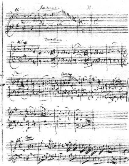
Letzte Doppelseite in Mozarts Werkverzeichnis: Zauberflöte, Titus, Klarinettenkonzert, kleine Freimaurerkantate