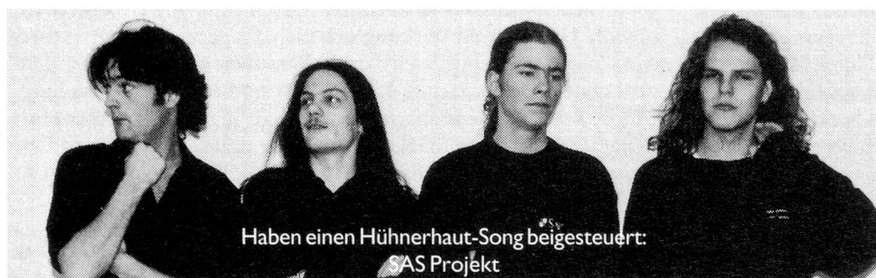
Haben einen Hühnerhaut-Song beigesteuert: SAS Projekt

Damit würden ca. zehn weitere Ostschweizer Rockgruppen, die bisher noch keine CD produziert haben, auf dem von jungen Bands geradezu mystifizierten Silberling erscheinen.