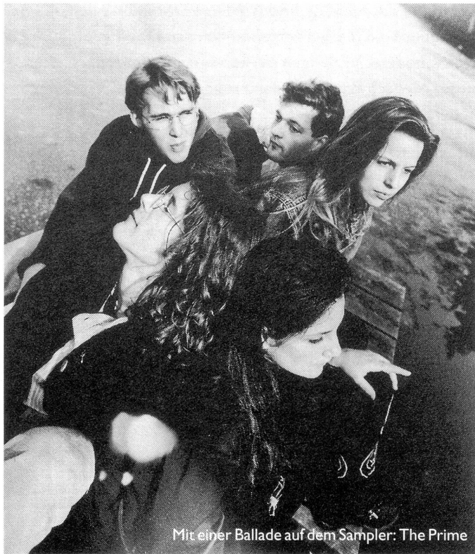
Mit einer Ballade auf dem Sampler: The Prime