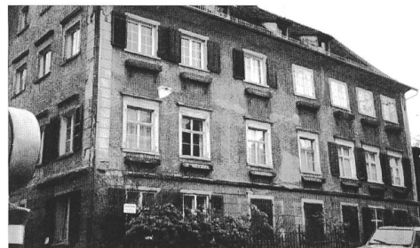
Das ehemalige jüdische Kaffeehaus in Hohenems