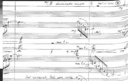
Ausschnitt: Vers I, Interludio I und Revitativo? aus "Echnaton's Hymnos to Aton"