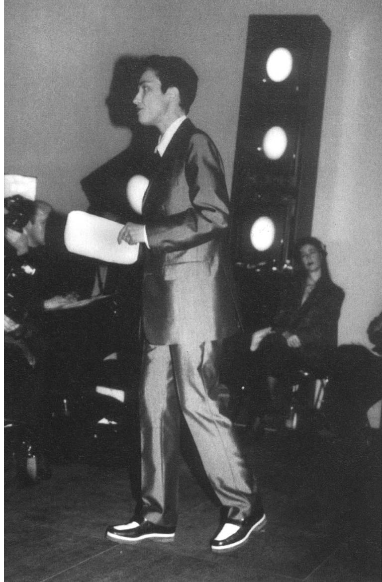
Lux! Wie weiland Winkelried die Speere empfängt Pipi die Projektionen und lässt das Licht gebündelt durch ihren transparenten Körper fließen.

Zügen, Tunnels oder auf der Schiene, ist noch völlig offen.» Sollte der Vorschlag angenommen werden, werde man die Mitglieder «ziemlich subito» informieren. Denkbar wären – vermutlich in diesem Sommer – eine offene Ausschreibung oder ein interner Wettbewerb.