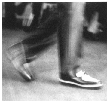
Pipis Füsse stecken in Schuhen, die vom «Gefühl der Verliebtheit beflügelt» sind.

Ein mässiger Februarabend in der neuen St.Galler Szenenbar «Tankstell» am Stadtausgang Richtung Kuhglocken, mit einer ansehnlichen, zufälligen Vertretung der Kunstszene. Thema: Beziehungsklatsch, die Expo ziemlich fern. Der Journalist fragt einen flott-beschwingten Vierertisch. «Die Expo, pah, das ist doch die Fehlinvestition des Jahrhunderts», sagt einer salopp. Andere sind sich ihrer Sache nicht so sicher: «Hm, wirklich? Meinst du nicht, man sollte...» Ein Dossier für das «Jekami» hat niemand gesehen.