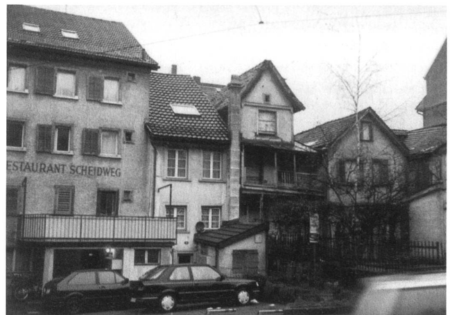
Ein ganzes Stück Quartierleben blockiert: Anfangs der Speicherstrasse wird seit Jahren an eine Überbauung gedacht.

Namen hatten wir im Dreilindengang vorher nie gehört.