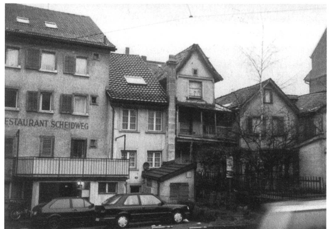
Ein ganzes Stück Quartierleben blockiert: Anfangs der Speicherstrasse wird seit Jahren an eine Überbauung gedacht.

Das schmerzt. «Weg mit den Hütten, Wohnraum für Familien». Zerstört wurde mehr, ein Wohnbiotop, ein Stück Quartiergeschichte.