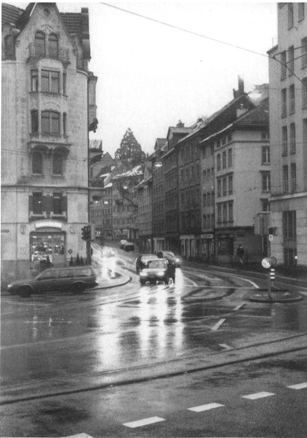
Spisertor: Das Tor vom Zentrum hinaus in den wilden Südosten der Stadt.