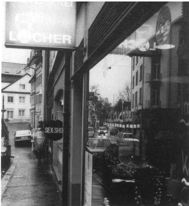
Sanchez weg, der «Walfisch» gestorben und Debrunner tot. Was vom «alten Linsebühl» geblieben ist: Die Bäckerei Capelli, Velo Pfiffner und – Tür an Tür mit einem Sex-Shop – die Metzgerei Locher.