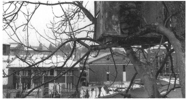
Wolfganghof Haggen: Stilleben mit Bauernhaus, Neusiedlung und Baumhütte.

Geländer der Brücke hinauslehnen, dann über dieses hinausklettern und wieder zurück. Zu den harmlosen Spielchen gehörte: Badehose die 98 Meter hinunter segeln lassen, hinterher spucken, und diese (die Badehose) unten wieder finden. Mehr als einmal landete sie auf einem Baum oder dem Dach einer der Zweibrücken. Katastrophe: in Wattbach oder Sitter.