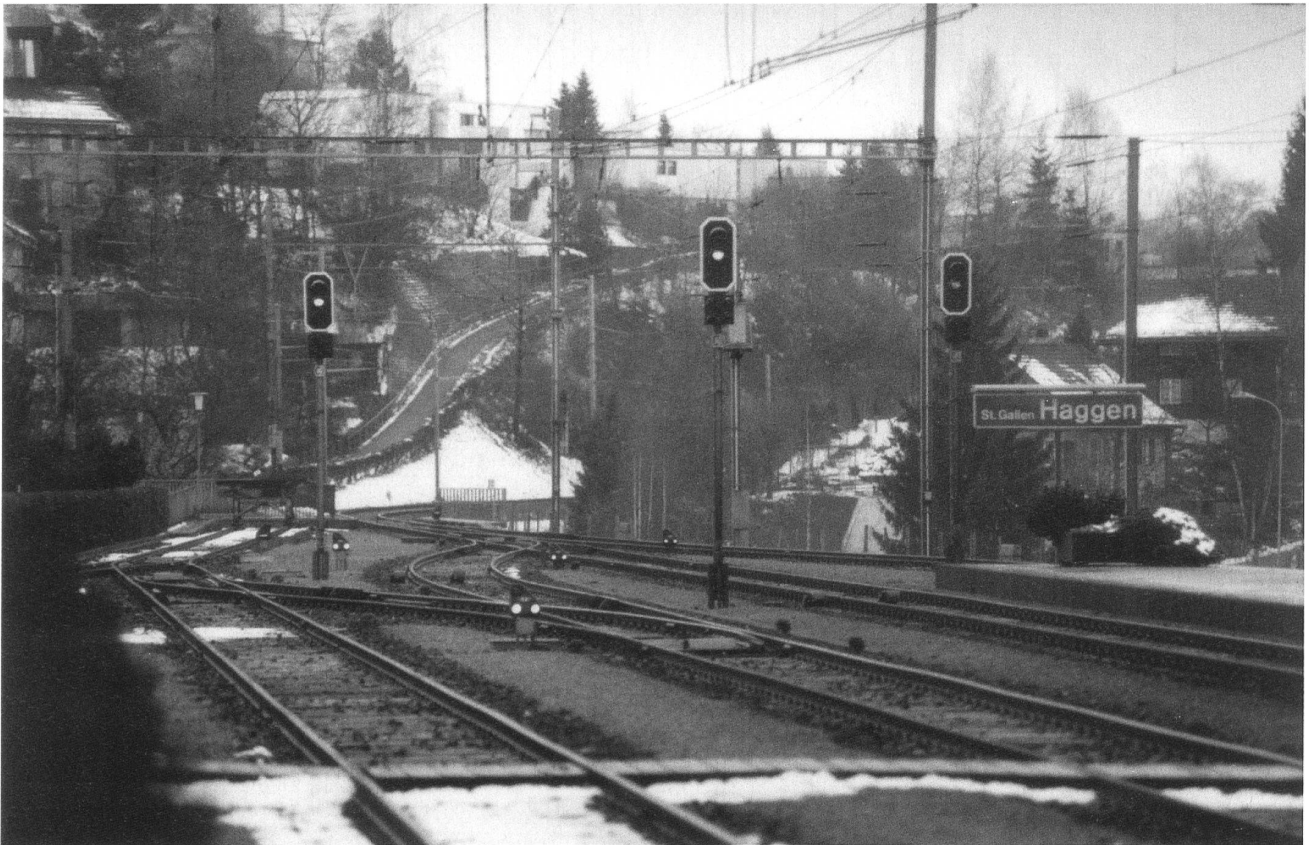
Bahnhof Haggen. Zwischenstation im Niemandsland zwischen St. Gallen, Gossau und Herisau.