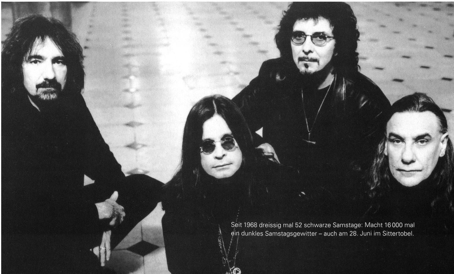
Seit 1968 dreissig mal 52 schwarze Samstage: Macht 16 000 mal ein dunkles Samstagsgewitter – auch am 28. Juni im Sittertobel.

Nun versuchen Black Sabbath, 29 Jahre nach dem ersten St.Galler Auftritt und mit ihrem letzten Album «Forbidden» im Gepäck, am diesjährigen St.Galler Open Air erneut ein Revival. Natürlich in der Originalbesetzung mit Ozzy Osbourne, Tony Iommi, Geeze Buttler und Bill Ward. Wir sind gespannt. ■