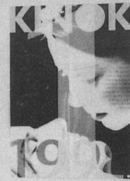
Ergonomisch: Die «Kinok»-Bar an der Grossackerstrasse