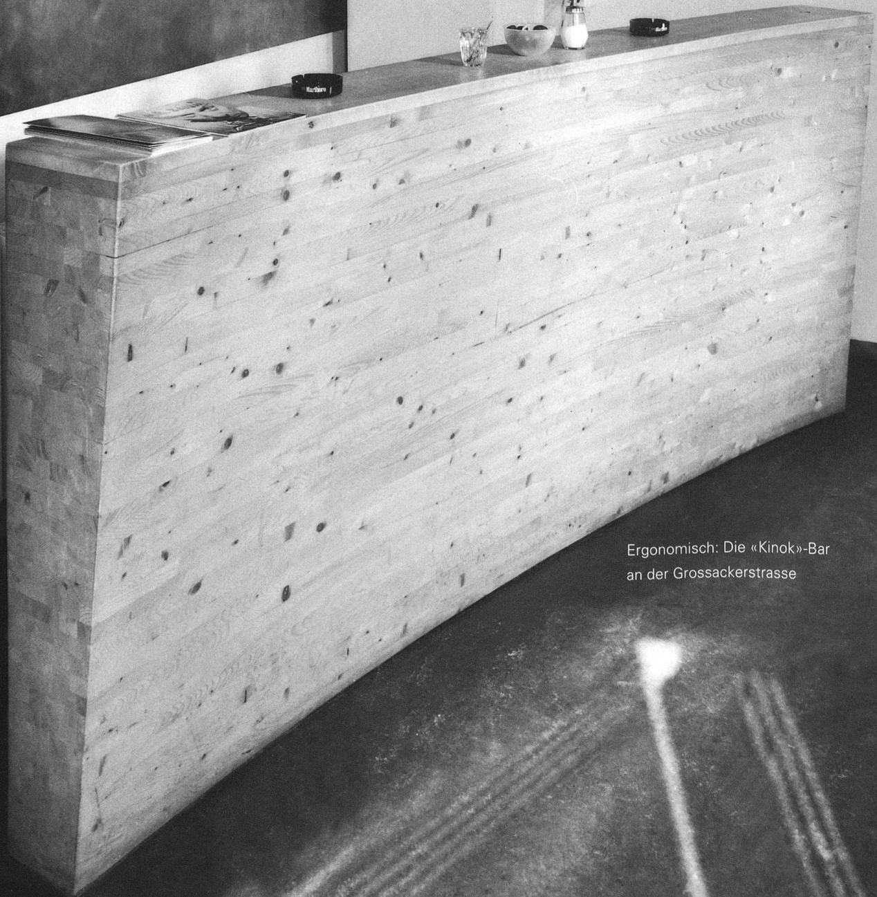
Ergonomisch: Die «Kinok»-Bar an der Grossackerstrasse