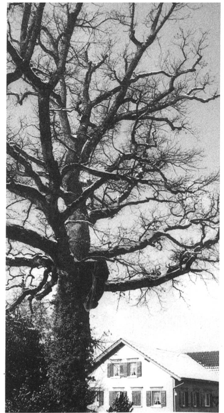
Die Dorfeiche mitten in Bernhardzell.

Oberbüren – St.Gallen – Bernhardzell. Man muss sich die Orte zusammensuchen. Es sei denn, man fährt ins Appenzellerland. Hier trifft man allenthalben auf sie. Und wenn das Wetter miserabel ist oder die Zeit zu knapp, kann man sich daheim ein Buch über diese Region vornehmen, Peter Maurers wunderbaren Fotoband «Gesichter am Alpstein» (1998) zum Beispiel. Den ganzen «spirituellen Fundus» des Appenzellerlandes enthält er zwar nicht, von der Spiritualität dieser Bergregion vermittelt er aber doch einen faszinierenden Eindruck. Dabei zeigt er auch, dass man in der «ausgelatschten» und halb zu Tode vermarkteten Gegend schon den «Hintereingang» nehmen muss, um ihrer Spiritualität wirklich