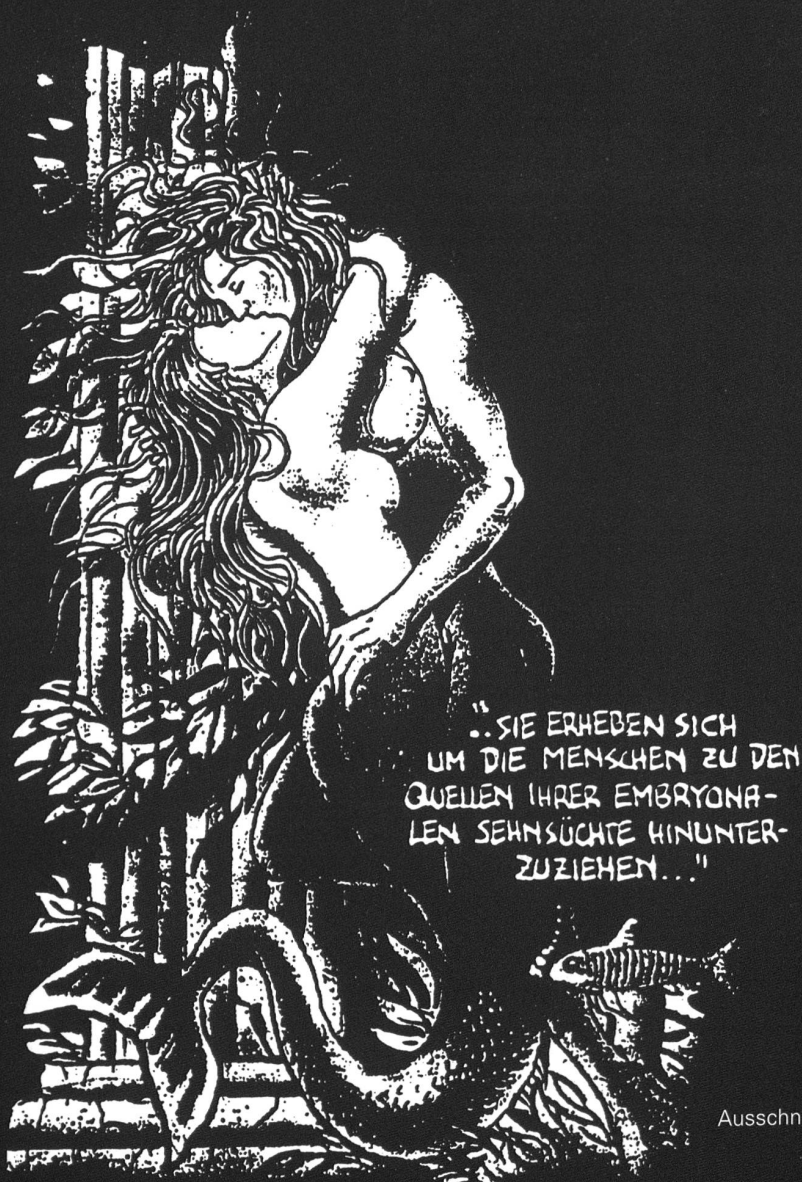
Ausschnitt aus der Comic-Version von Akrons «Dantes Inferno».