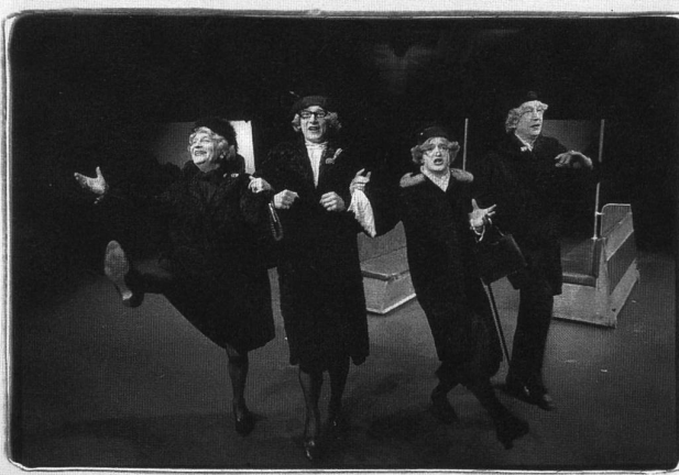
Legendär: Die Wilmersdorfer Wittwen aus dem Grips-Klassiker «Linie 1»

Im «Tagesspiegel» riefen FreundInnen zur Solidarität mit dem Grips auf, worauf das Büro des Theaters fast zusammenbrach unter der Flut der eingehenden Sympathiebekundungen. Die Hetz- hatte sich in eine fabelhafte Werbekampagne entwickelt.