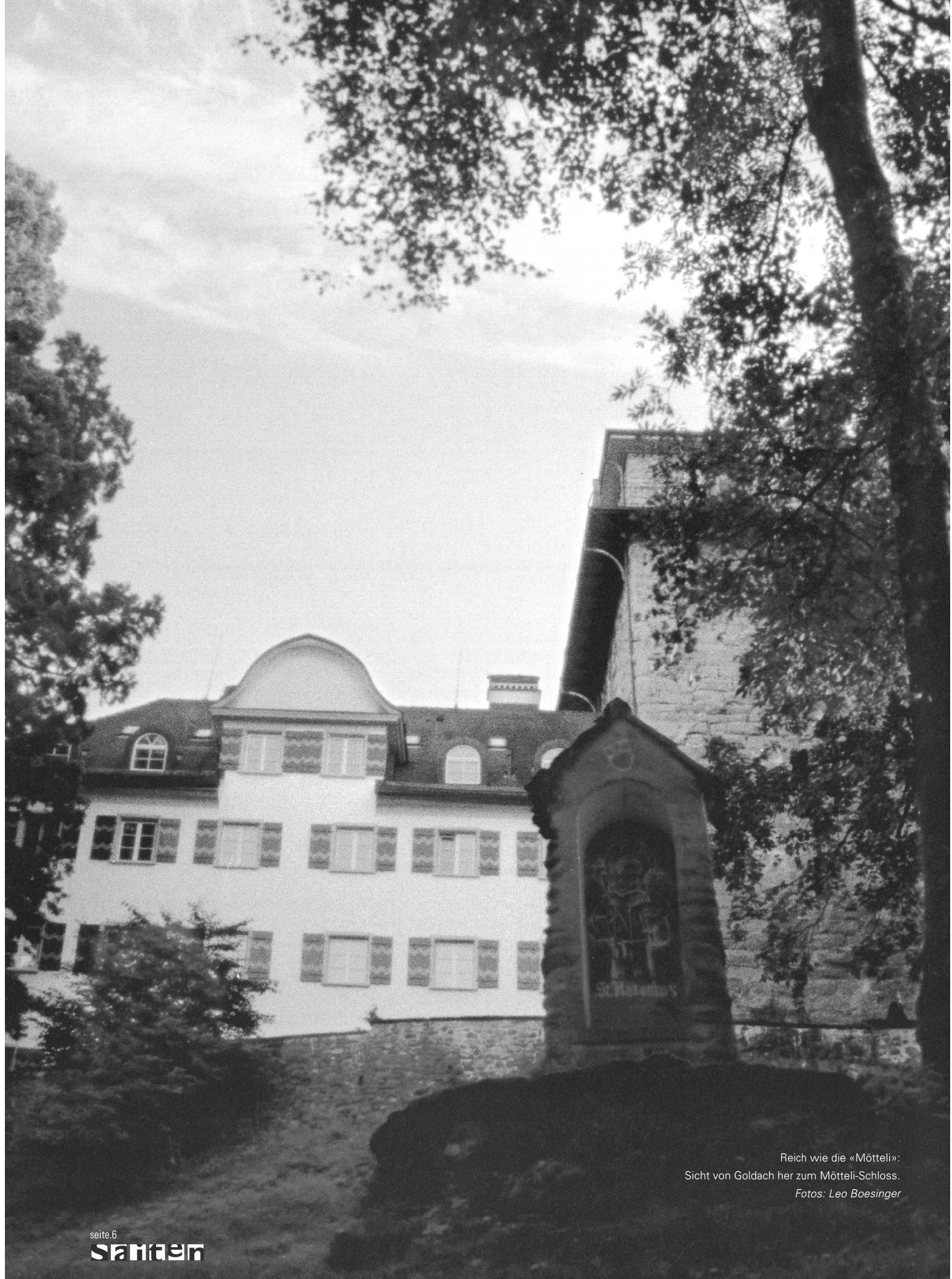
Reich wie die «Mötteli»: Sicht von Goldach her zum Mötteli-Schloss.