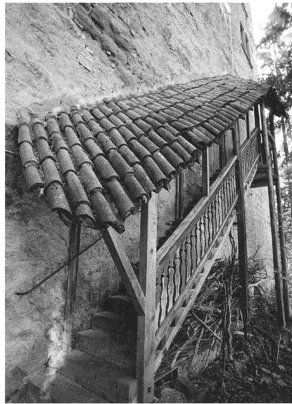
Dramatische Vergangenheit: Das St. Anna-Schloss bei Rorschacherberg