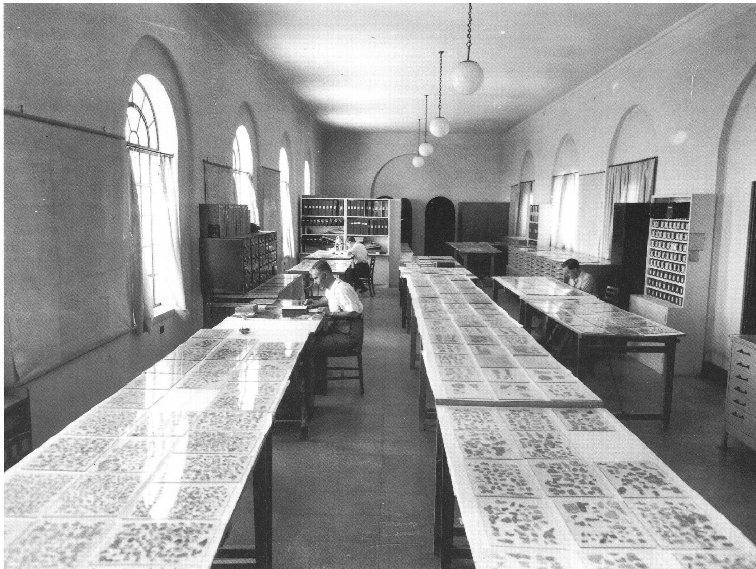
Unverhoffte Herausforderung für die Wissenschaft: Qumran-Forschung in den 50er Jahren.

lung in der Stiftsbibliothek zu sehen sein, zusammen mit anderen Manuskripten, die Bezüge zwischen St.Gallen und Qumran herstellen. Am Bodensee wie am Toten Meer war eine religiöse Gemeinschaft Urheberin einer grossartigen Bibliothek, die neben biblischen Schriften und Kommentaren auch Gemeinschaftsregeln, liturgische und wissenschaftliche Werke umfasste. Erstaunlich ist das hohe Niveau, auf dem an beiden Orten die Schriftlichkeit gepflegt wurde. Auch in St.Gallen stand die Bibel im Zentrum der schriftlichen Überlieferung. Es macht also inhaltlich durchaus Sinn, die Schätze vom Toten Meer in St.Gallen zu zeigen.