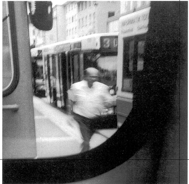
In der Frauenfeld-Wil-Bahn in Frauenfeld.

steckt dahinter die Idee, alle 17 Bahn- und Busbetriebe der Region in einem Verbund zusammenzuschliessen. Künftig wird man mit der S1 von Wil nach Altstätten fahren, mit der S4 von St.Gallen nach Uznach, mit der S11 nach Appenzell und der S12 nach Trogen.