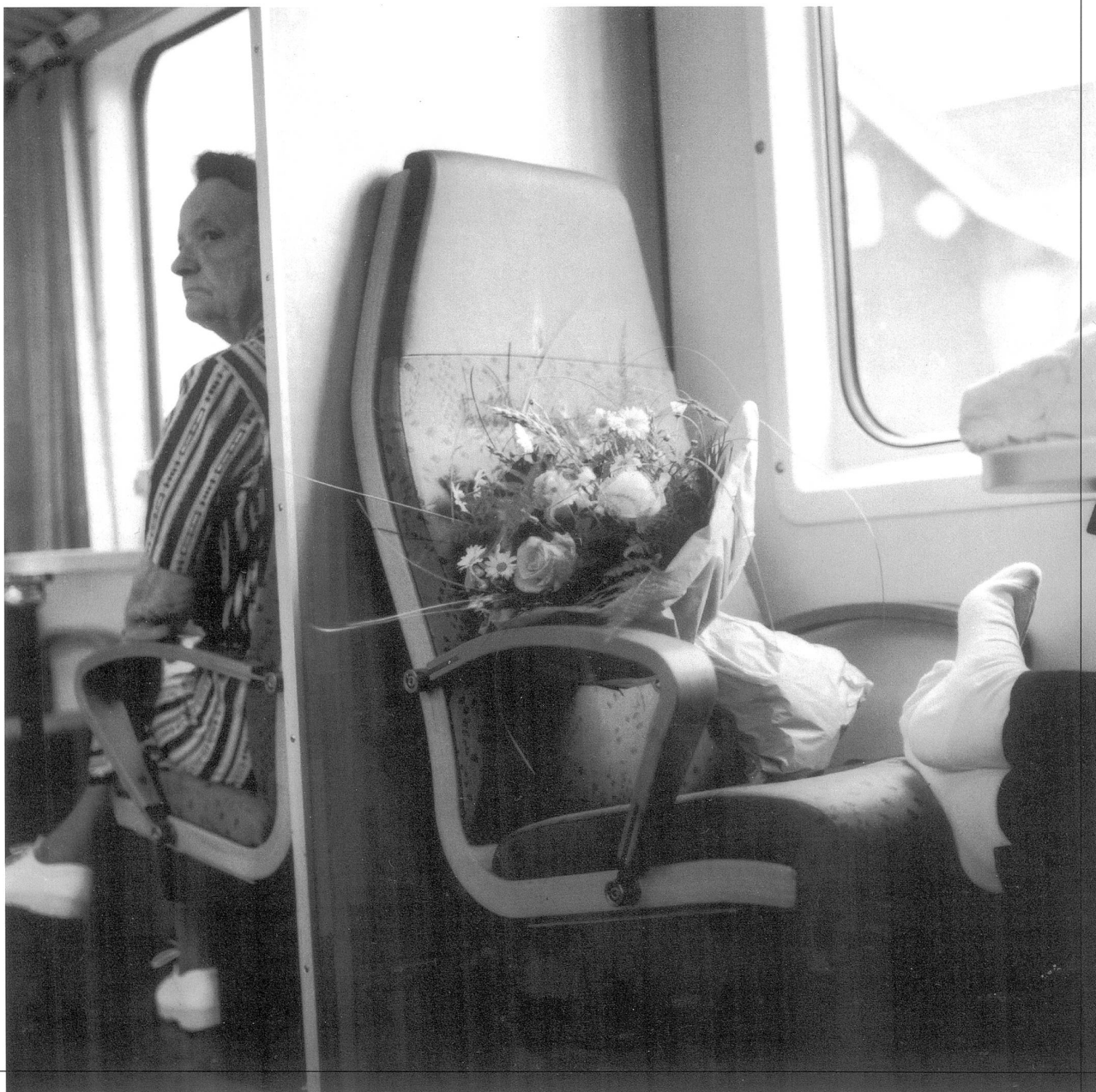
Bistrowagen Wattwil – St.Gallen