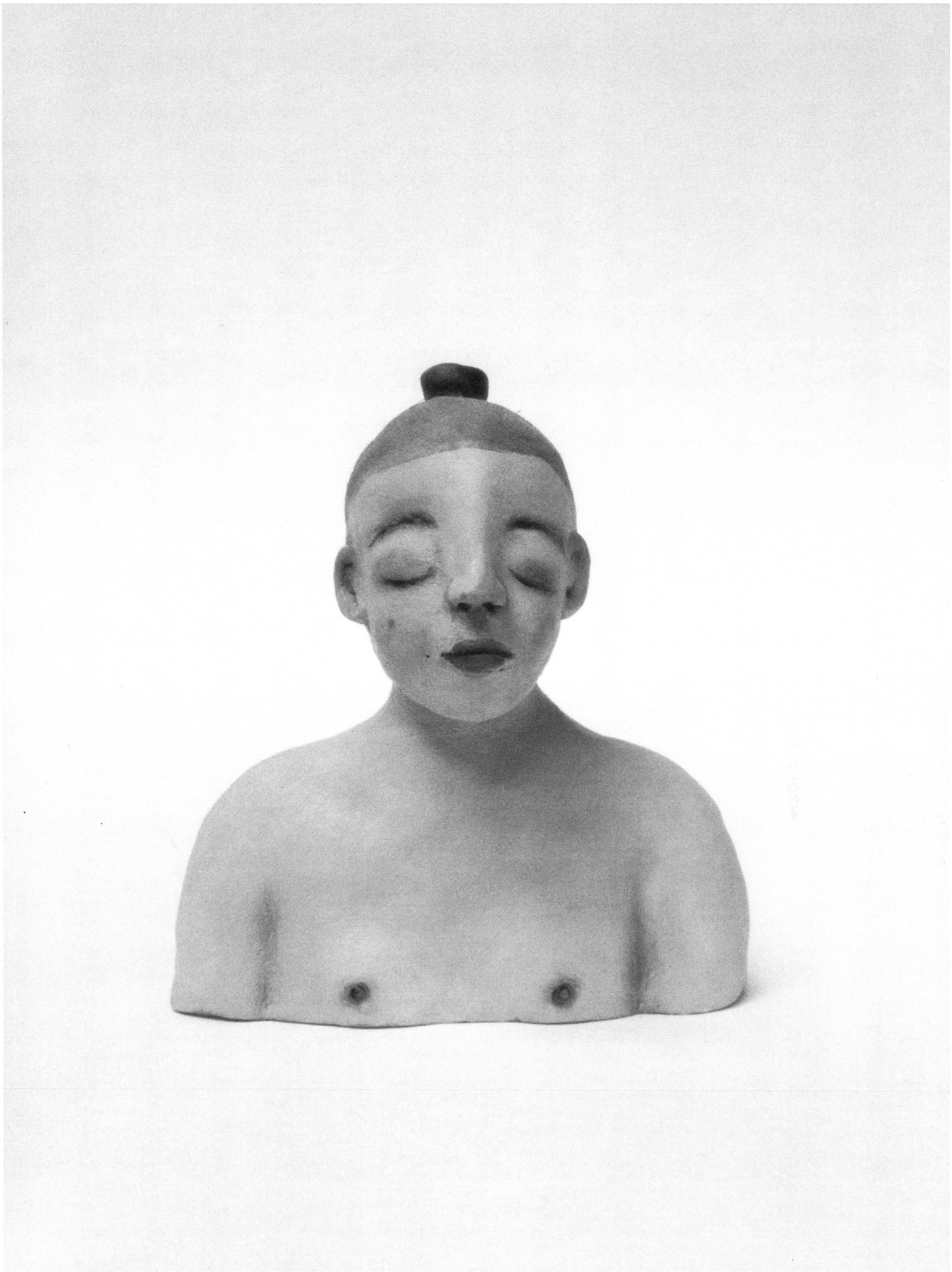
KONTEMPLATION. Marlies Pekarek-Wildbolz, Büstenfigur, Ölfarbe auf Bronze, 9 x 4 x 11 cm, 2001