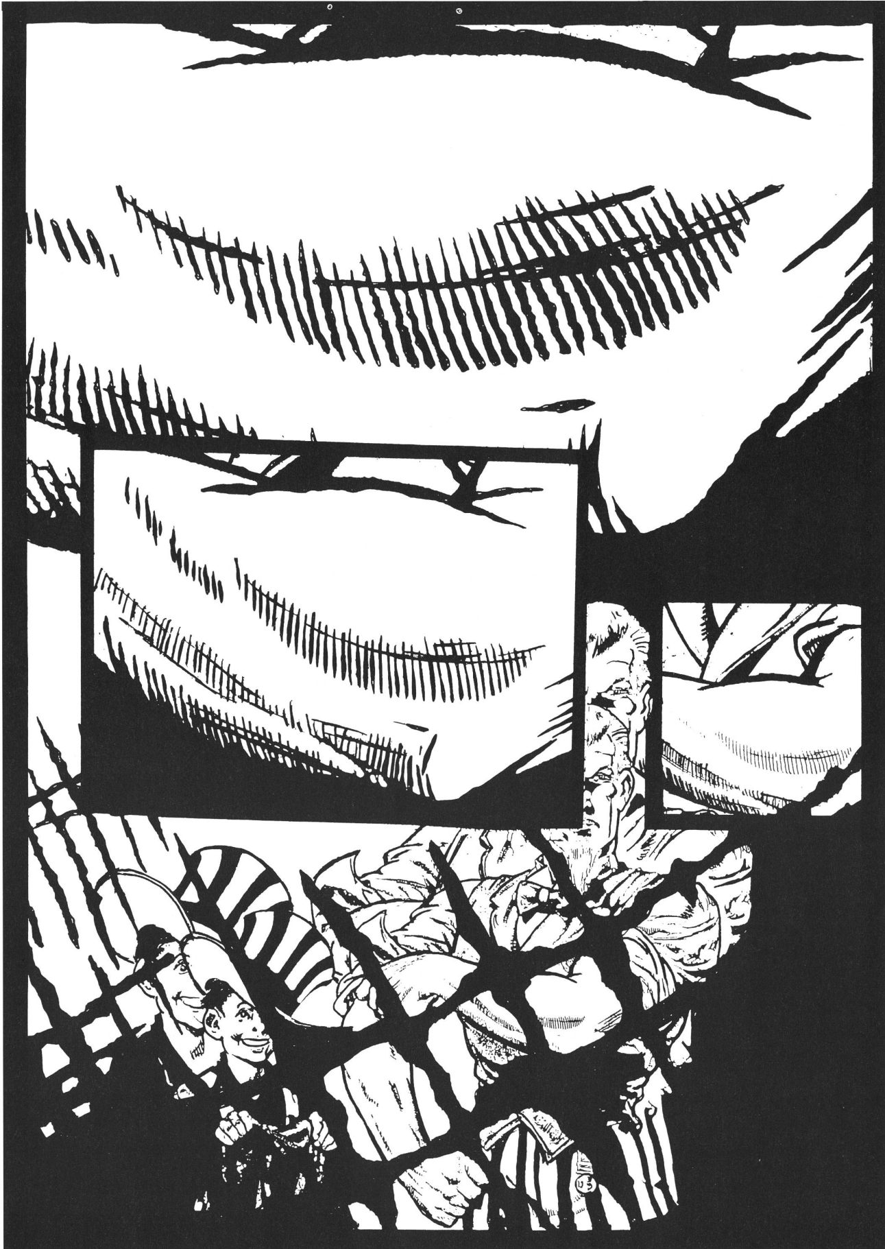
«Uncle Sam Muscle Zoom (to Reed Crandall)» Mark Staff Brandl, Tusche auf Papier, 2001