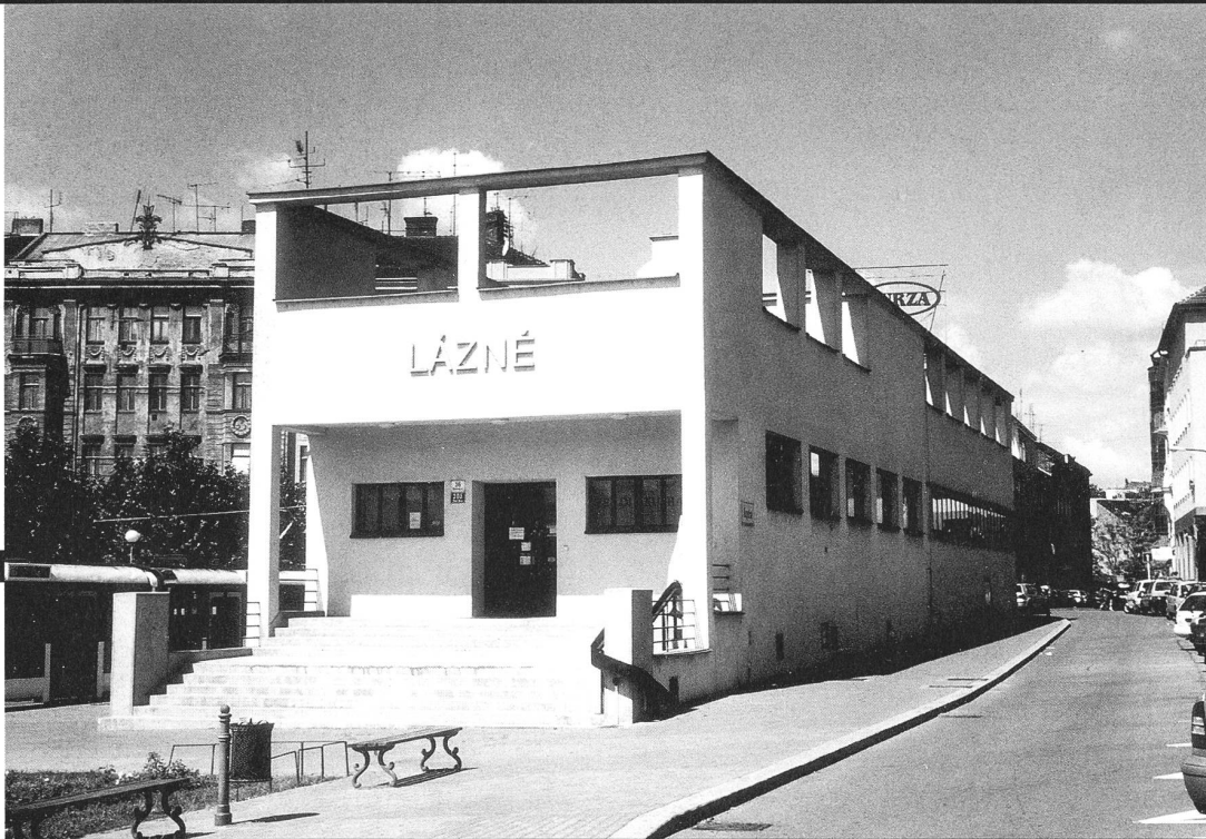
«Lázně»; Bad-Architektur von Bohuslav Fuchs in Brunn

aber ich habe den Eindruck, rücksichtsloser Wettbewerb und skrupelloses Gegeneinander liegt diesen Menschen einfach nicht. Einige haben es freilich geschafft, sind erfolgreiche Unternehmer geworden, haben eine nette Wohnung, ein neues Auto und fahren ins Ausland auf Urlaub. Sie sind keine Ausnahmen, aber weit davon entfernt, die Regel zu bilden. Die Stundenlöhne für unqualifizierte Arbeit liegen heute zwischen 2 und 5 Franken, während eine Schneiderin monatlich ca. 400 Franken brutto verdient, 700 ein Mittelschullehrer. Nahrungsmittel sind erschwinglich geblieben, doch Benzin ist z.B. so teuer wie im Ausland (2 Liter Benzin kosten soviel wie 50 km Bahnfahrt, 3 grosse Biere oder eine einfache Mahlzeit im Gasthaus). Die Menschen haben begriffen, dass auch unter den neuen Verhältnissen unerfüllte Träume bleiben werden, dass das Modell «West» nicht der Schlüssel zum Glück ist. Ein Beitritt zur EU spaltet wie überall die Meinungen. Während sich die Älteren eher davor fürchten, freuen sich die Jungen v.a. auf die Möglichkeit, im Ausland zu studieren. Im Ausland arbeiten, das möchten sie hingegen nicht. Schon heute, da z.B. für Computerspezialisten die Möglichkeit bestünde, auf dem ausgetrockneten deutschen Markt Fuss zu fassen, verzichten sie darauf. Für sie gibt es auch hier reichlich und gut bezahlte Arbeit.