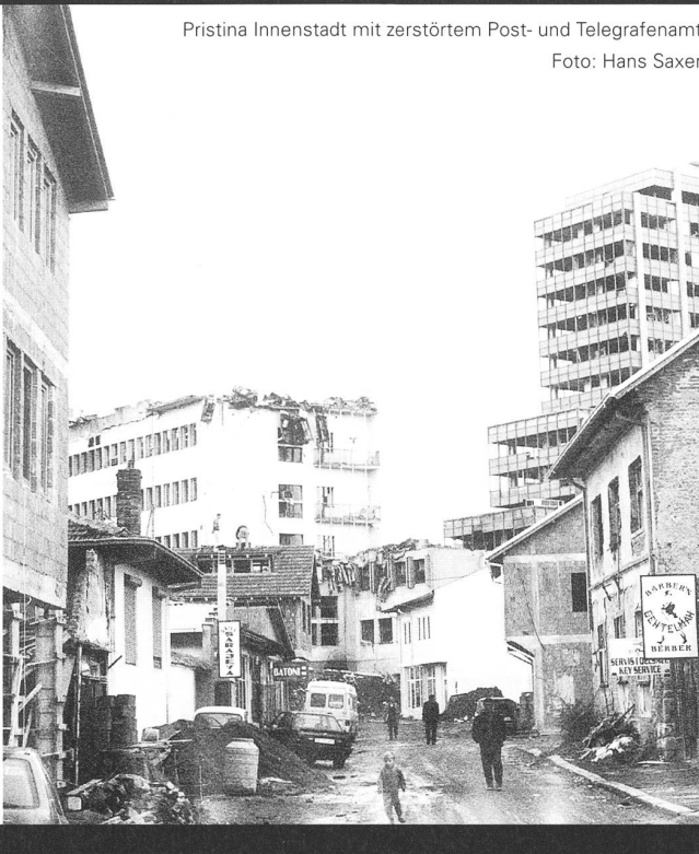
Pristina Innenstadt mit zerstörtem Post- und Telegrafenturm

lichen Aufschwung, niemand will investieren. Die Angst, wieder vor dem Nichts zu stehen, lähmt alles. Man versucht zwar, den Schwarzhandel von Luxusgütern mit Zollkontrollen zu Mazedonien und Albanien einzudämmen. Für die Bevölkerung ist Luxus kaum erschwinglich. Der durchschnittliche Monatslohn liegt bei 200 Mark. Deshalb weichen viele auf Imitationsgüter aus der Türkei aus. Anders sieht es beim Nahrungsmittelmarkt aus. Dort herrscht ein buntes Treiben. Obst und Gemüse aus Albanien, der Türkei oder Mazedonien. Ich kaufe ein Kilo Trauben für 80 Pfennige. An den Markteingängen warten alte Männer und Knaben mit Schubkarren auf Kundschaft. Junge Kosovaren bieten an den Strassenkreuzungen mit abbruchreifen Traktoren und Anhängern Transportdienste an. Der Schwerverkehr erfolgt mit Traktoren oder Pferdefuhrwerken. Ein Busbetrieb wird auf privater Basis mit klapperigen Kleinbussen aufrechterhalten. Für 50 Pfennige fährt man rund 20 Kilometer.