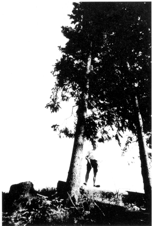
Kleine Höhe, kleine Freude.