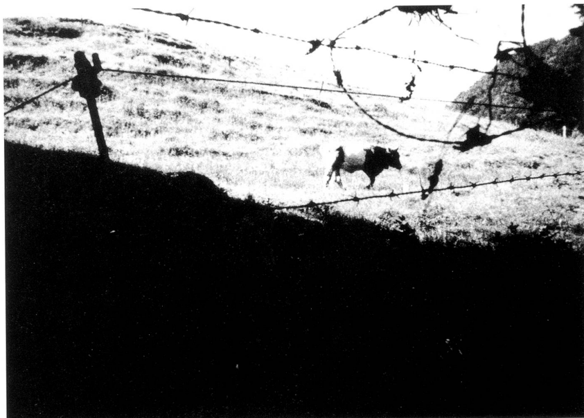
Alles dabei: Kühe, Stacheldraht, steile, feuchte Wiese.