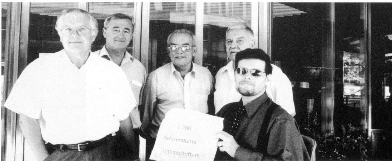
Fünf Mitglieder des Referendumkomitees beim Einreichen der 1200 Unterschriften.

«t.hauses» nicht in die Planung einbezogen hat. Und tatsächlich hat die Stadt miserabel über das Projekt informiert: So wurde die neue Theaterhalle im Kulturbericht, der im Herbst letzten Jahres an den Gemeinderat ging, nur unter ferner liefen erwähnt. Im Budget 2002 wurden keine Rückstellungen für das Theaterprojekt vorgenommen. Schliesslich ist Mummenschanz tatsächlich nicht unbedingt die Künstlergruppe, auf der man nach dem Sitterthal-Fiasko weiterhin die städtische Kulturpolitik bauen müsste. Nur heisst all dies nicht, dass das Projekt Mummenschanz, so wie es vorliegt, schlecht ist. Es heisst ganz einfach, dass in St.Gallen keine Kulturpolitik gemacht wird, die diesen Namen verdient.