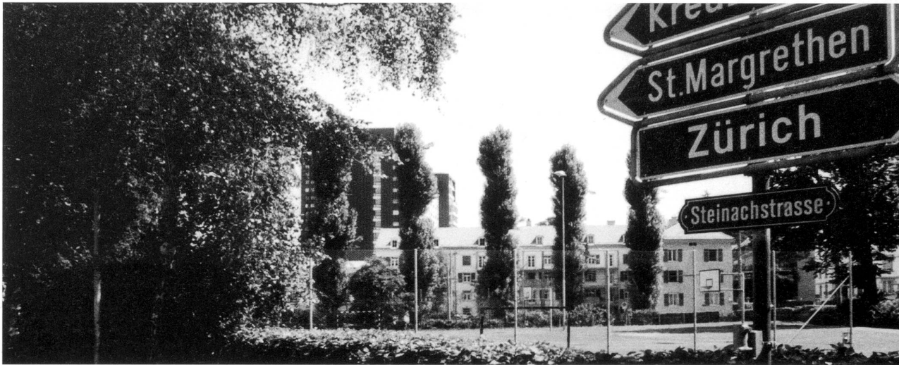
Geplanter Standort für das Mummenschanz-Projekt: die Volksbadwiese

rungsraum erste Priorität. Die Suche, bei der unter anderem auch das Kino Tiffany geprüft wurde, blieb erfolglos. Mit dem Mummenschanz-Theater, das speziell für den Tanz konzipiert war, rückte eine Lösung in greifbarer Nähe. Interesse am Gebäude bekundete aber auch die freie Tanzszene, in der seit längerem die Idee eines so bezeichneten «t.hauses» herumgeisterte: Ein Gebäude sollte gefunden werden, in dem Tanz, Ton, Text und Theater, aber auch Performance, bildende Kunst und neue Medien in einer allumfassenden Interaktion zueinander finden konnten. Auch dieser Diskussion gab das Mummenschanz-Theater Auftrieb.