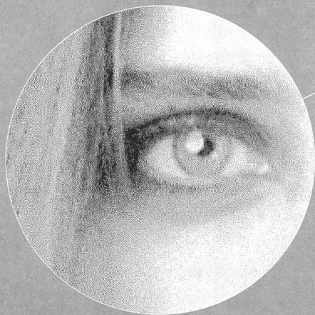
320 %, Neu Staccato Raster 10 mp

Niedermann druckt Punkte für Akris. Unsere neuen Druckpunkte sind hier in der Vergrößerung gut von den bisherigen Rasterpunkten zu unterscheiden. Deshalb wird die Mode von Akris detailgetreu wiedergegeben. Die Revolution in der Drucktechnologie (Staccato Raster) und entsprechendes Know-How ermöglichen erstmals diese Fotoqualität.