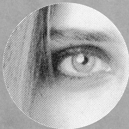
320 %, Herkömmlicher 60-er Raster