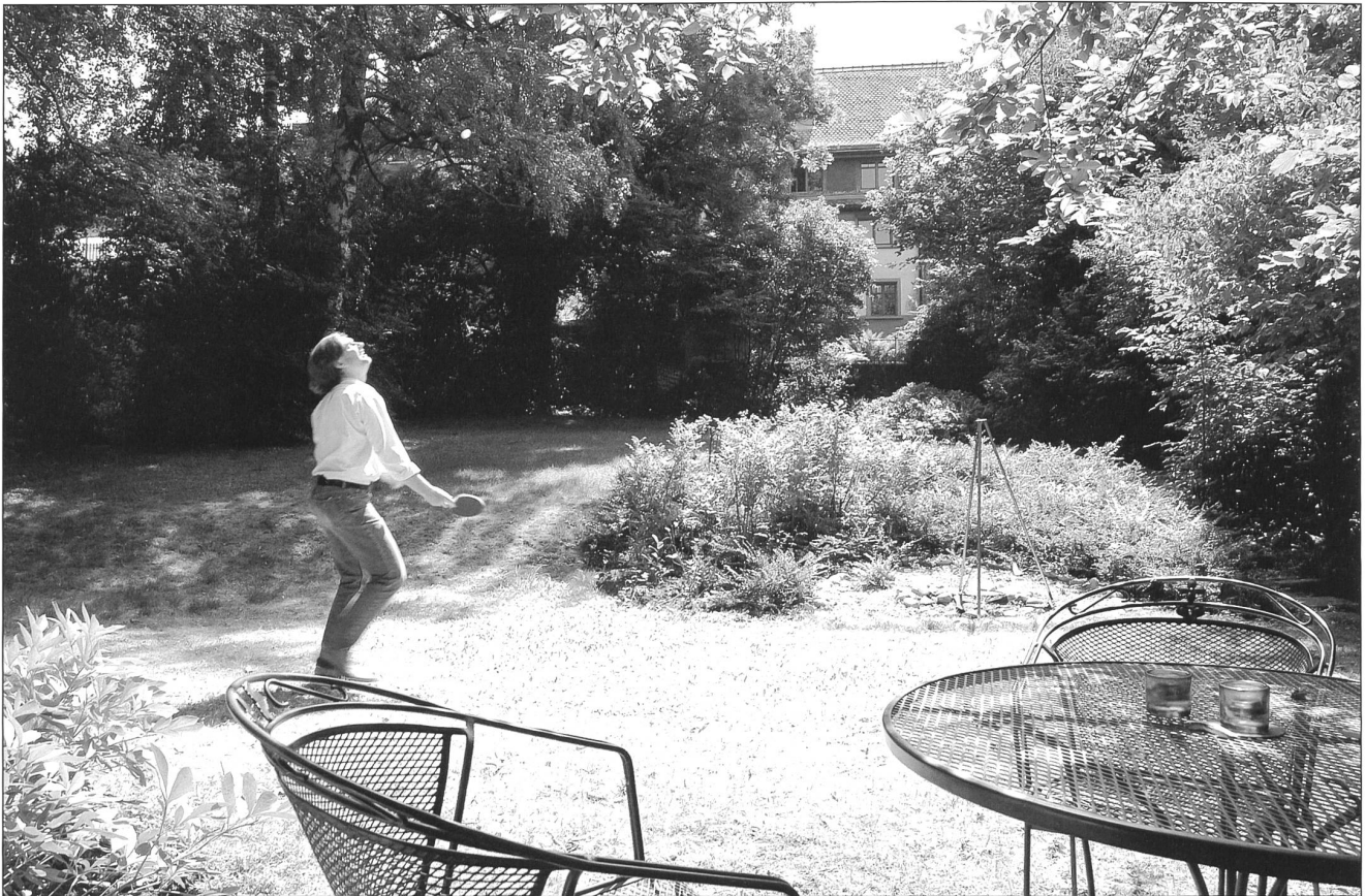
Vergessener Garten, wiederentdeckt.