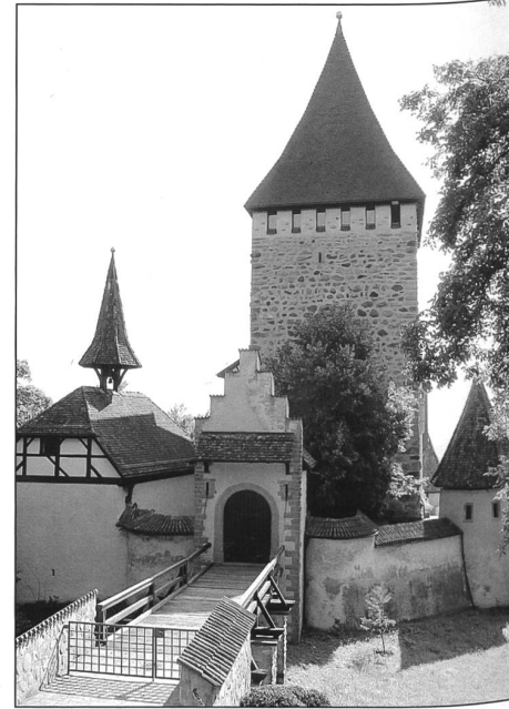
Pfister... Baron von Finck.

sichtbare Statussymbol bleibt das Haus. Fassade, an der schon vieles gemessen wird. Die restliche Identität wird verheimlicht. Vielleicht ja gar nicht mal zu unrecht: Was wäre die Welt auch ohne Anlass zur Neugier?