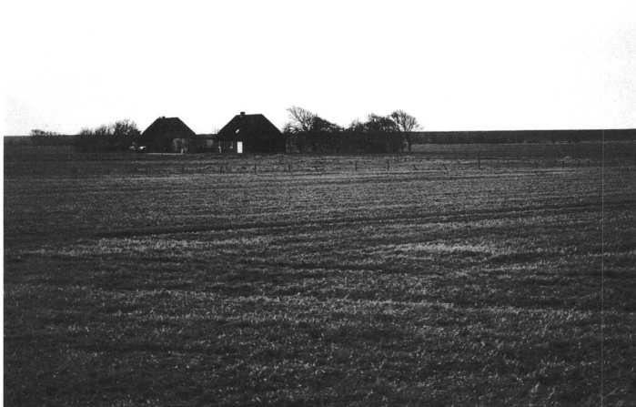
Reussenköge (Deutschland), 362 Einwohner