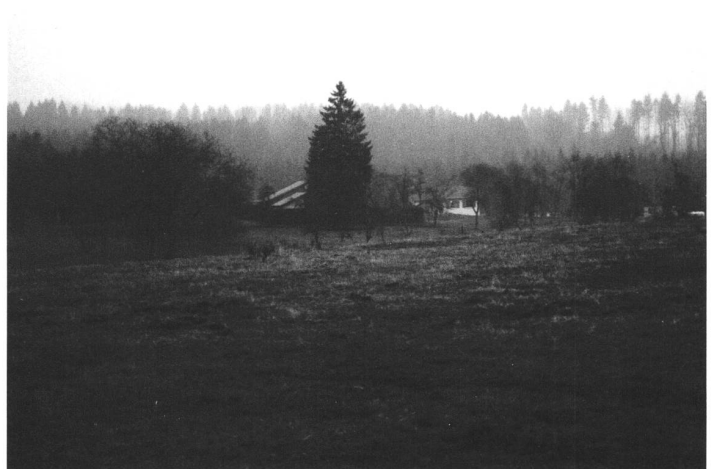
Ornes (Frankreich), 6 Einwohner