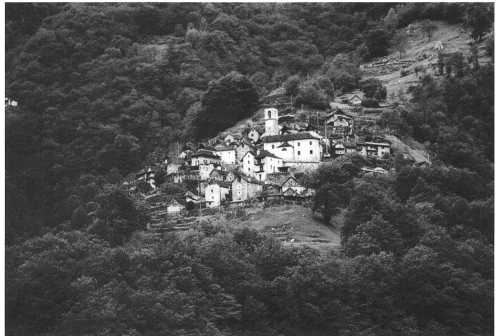
Corippo (Schweiz), 22 Einwohner

Gäste» ins Leben gerufen, eine Bar im eigenen Atelier für Sonderaufgaben im St.Galler Lagerhaus, wo sich Donnerstag für Donnerstag gemäss Statut höchstens zwölf Menschen treffen. Ziel, im besten Fall: Dass sich Leute kennenlernen, die beruflich, sozial aus allen Himmelsrichtungen kommen. Blosser Nachbarschaftshilfe ist das alles nicht: «Unübliche Gemeinschaften sind in einer geregelten Gesellschaft wie der unseren im besten Sinn subversiv», erklärt Frank. «Sie stellen bestehende Abläufe in Frage, eröffnen neue Denkmöglichkeiten.» Und fügt verschwörerisch an: «Eine Zusammenarbeit ist nie auszuschliessen.» Jetzt also: Das Gipfeltreffen.