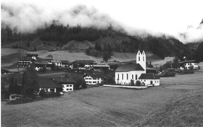
Gramais (Oesterreich), 53 Einwohner

«Eine Stunde Lebenszeit» hiess 1999/2000 ein erstes Projekt. In Berlin, St.Gallen und Kreuzlingen zogen sie mit dem Leiterwagen los und filmten 99 Leute bei ihren Tätigkeiten: Blumengiessen, Treppenwischen, Handorgelspielen. Weil die Handlung genau dokumentiert sein wollte, mussten die Passanten mithelfen – sogenannte Setmannschaften wurden gebildet. 2001/2002 folgten «Videoszenen», darin winken sich einander unbekannte Menschen freundlich zu. Wenig später wurde «Freunde &