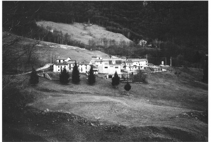
Morterone (Italien), 27 Einwohner