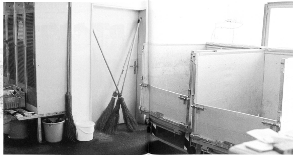
In der städtischen Besenkammer.

nicht mehr stellen will, ist in meinen Augen der Grundtrend. Wenn man mit den Leuten spricht, werden sie sagen: ja selbstverständlich, wir sind ja nicht auf dem Dorf, das gehört dazu. Aber es soll bitte meine Kreise nicht stören.