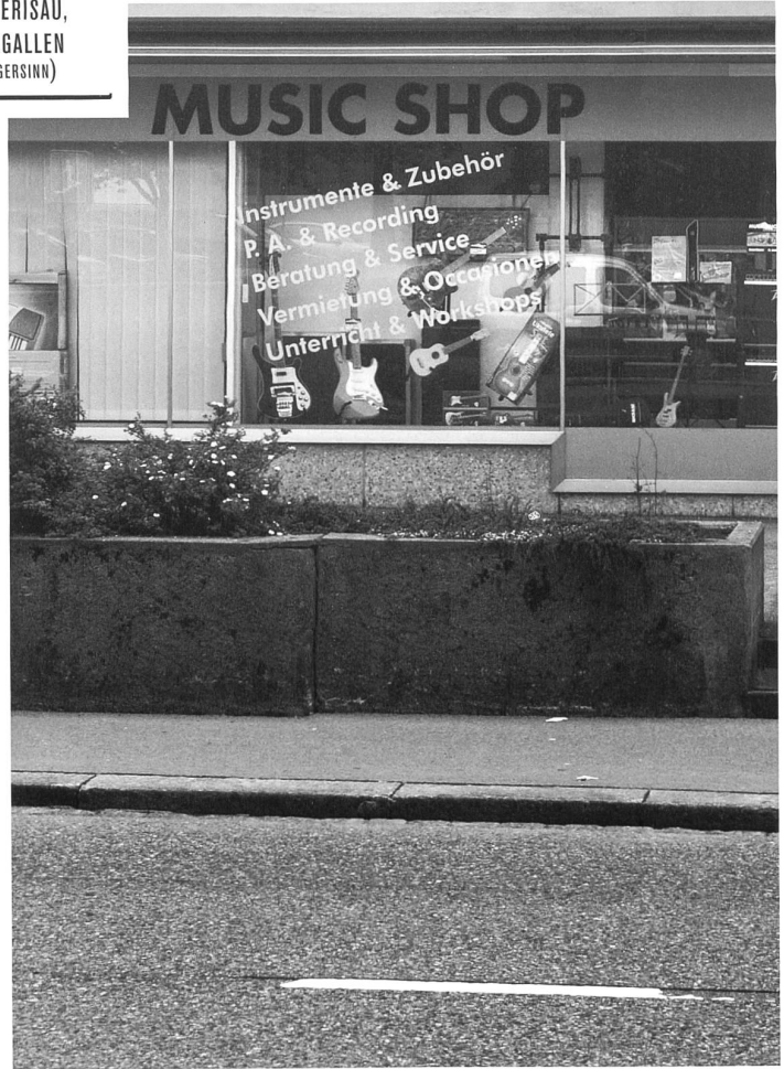
Bilder: Tobias Siebrecht