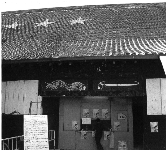
Die drei Sterne auf dem Dach des Seibu Kodo, einem Kulturzentrum der Universität Kyoto, stehen für die drei Studenten, die Anfang der 70er-Jahre während den Studentendemos bei Kämpfen mit der Polizei ums Leben kamen.

Am 16. Juni hat Koizumi bekannt gegeben, dass er im September 2006 zurücktreten will. Über seine Nachfolge kann viel spekuliert werden. Doch eines ist sicher: Sein Nachfolger wird wieder aus der allmächtigen liberal-demokratischen Partei (LDP) kommen. Und das heisst, dass sich im Grunde nichts ändern wird. Schöne neue alte Welt! Neben Nordkorea und Kuba ist Japan das einzige Land, in dem die gleiche Regierung seit über 50 Jahren ununterbrochen die Macht ausübt. Die Zeit ist reif für einen Ortswechsel!