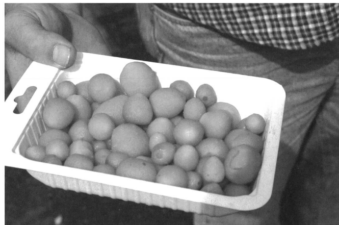
Bilder: Hansruedi Rohrer