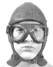
Haube Edellammnappa Futter Seide Baumwolle Klappschild, rot S-XXL SFr. 249.-