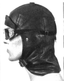
Haube Edellammnappa Futter Seide Baumwolle Klappschild, forrest S-XL SFr. 249.-