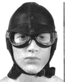
Haube Edellammnappa Futter Seide Baumwolle braun oder schwarz S-XXL SFr. 249.-