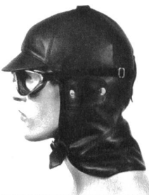
Haube Edellammnappa Futter Seide Baumwolle festes Dach, schwarz S-XXL SFr. 259.-

Wir leben wie Gespenster. In Schlangenlinien. Und das Leben fliesst aus. Sagen Rocket/Freudental. Sagenhaft sind die, schwerstens empfohlen, ein bockiges Duo aus München, veryvery lo-fi, schlau und hinterfotzig, auf eine gespenstische Art fröhlich und vor allem entrümpelt von allem, was einen ständig zurümpelt. Begleitet mich schon die ganze Zeit, seit es so saumässig heiss geworden ist, gestern, unmittelbar nachdem der letzte Schnee geschmolzen ist und die Temperaturen von null auf hundert gumpfen, in Fahrenheit wären sie immer dreistellig, Ozon noch dazu. Wir leben wie Gespenster, derzeit alle mitei-