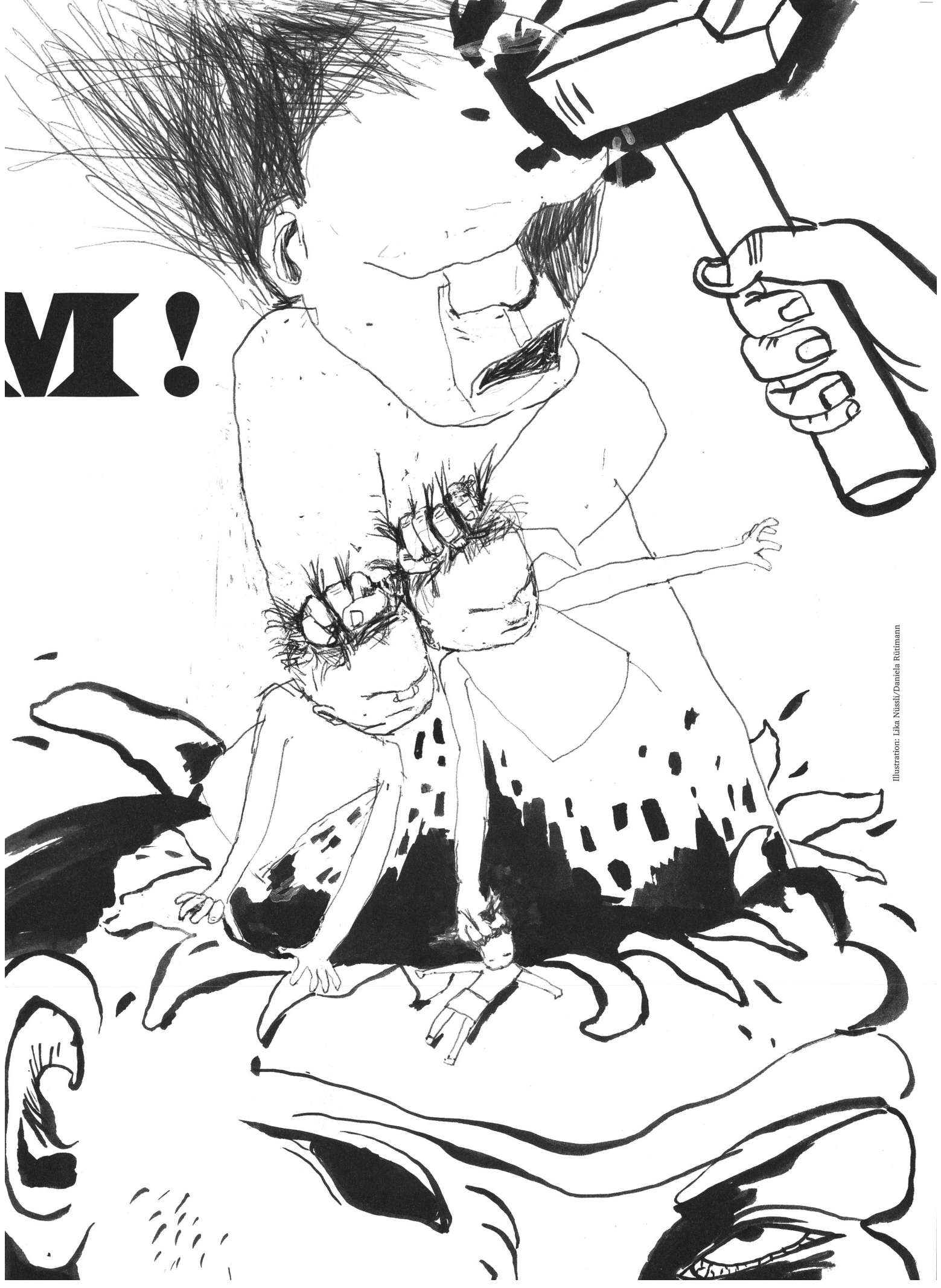
Illustration: Lika Nüssli/Daniela Rürimann