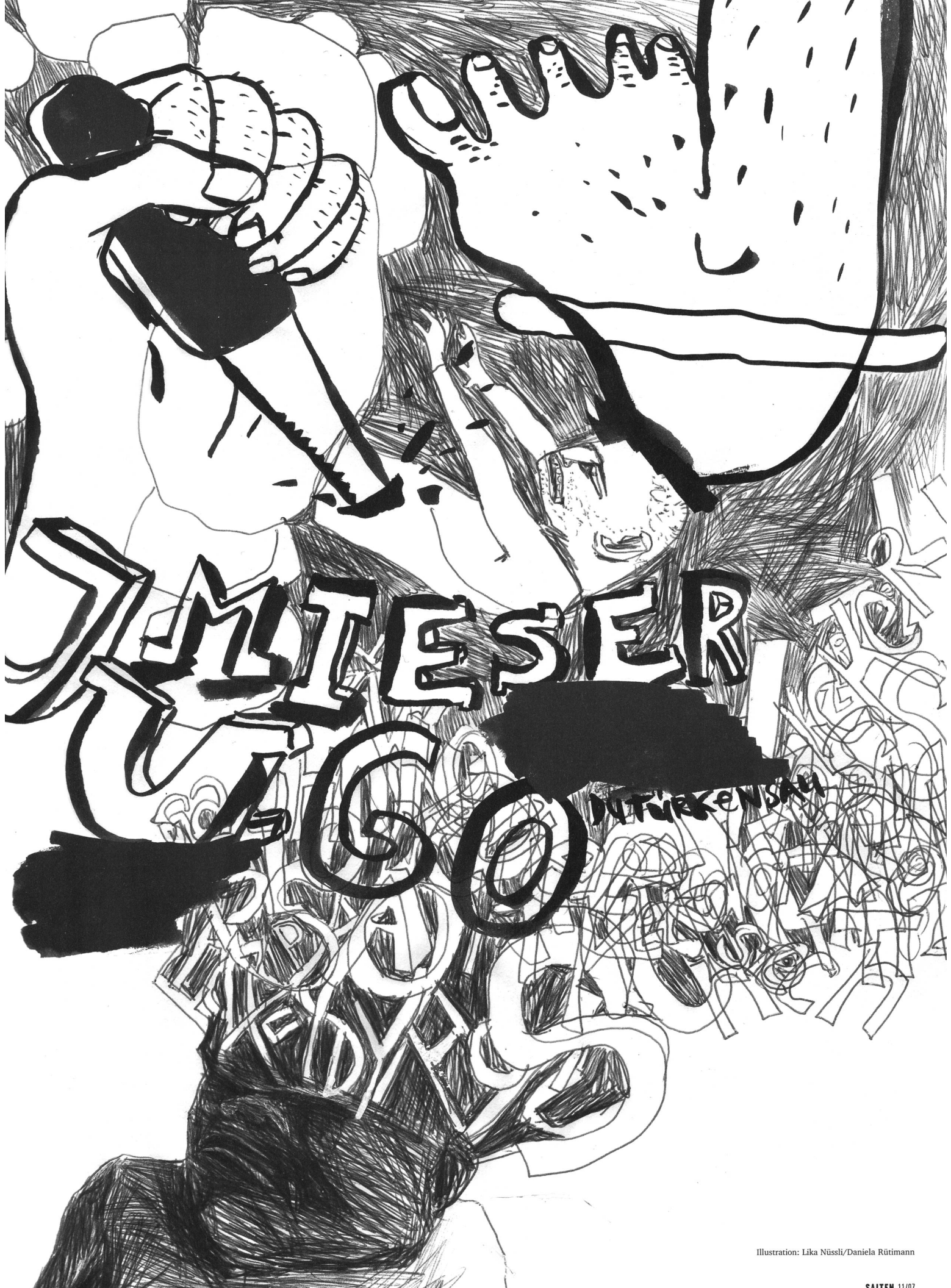
Illustration: Lika Nüssli/Daniela Rütimann