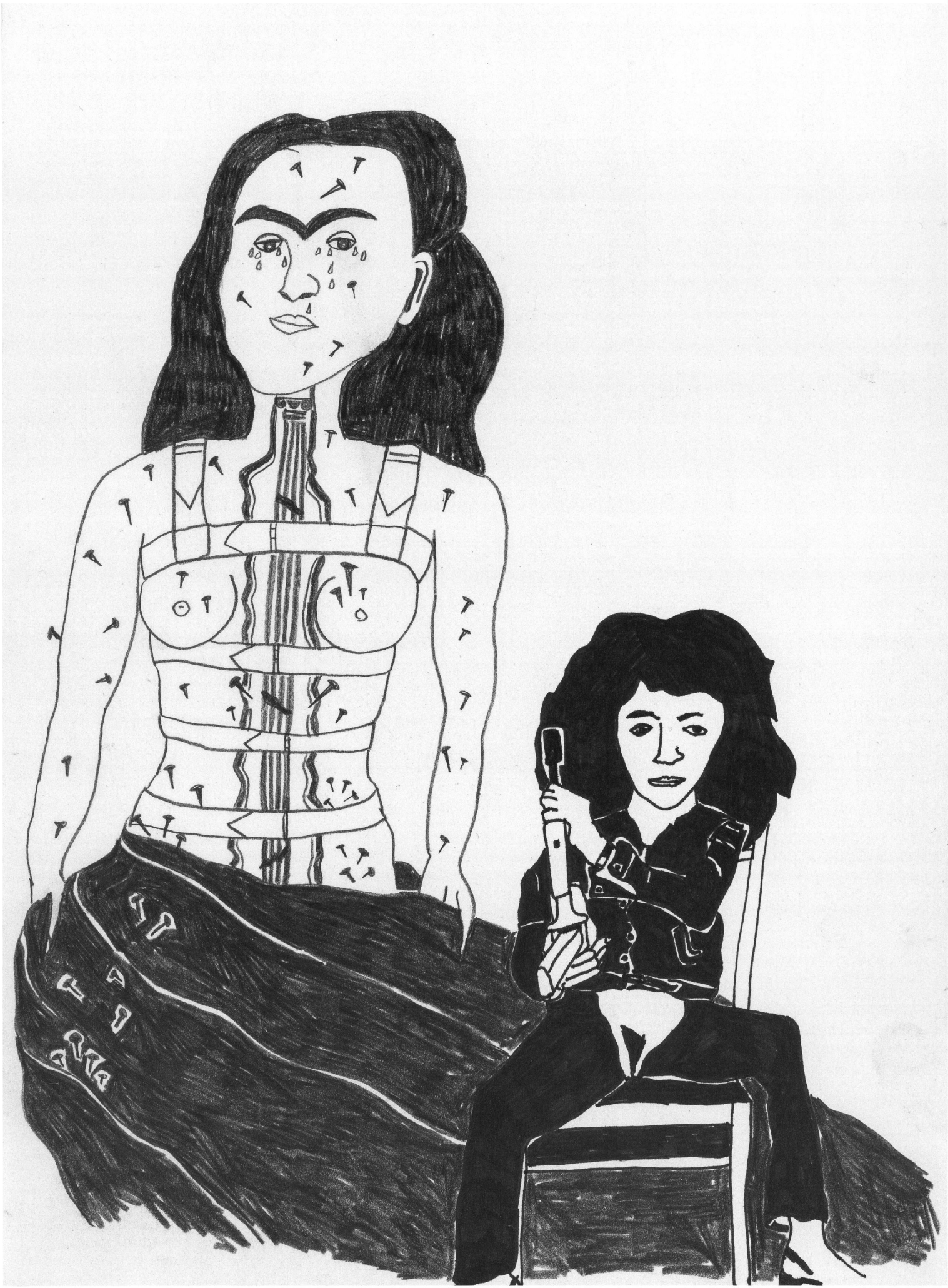
Illustration: Eva Rekafe. Nach Werken von Frida Kahlo und Valie Export.