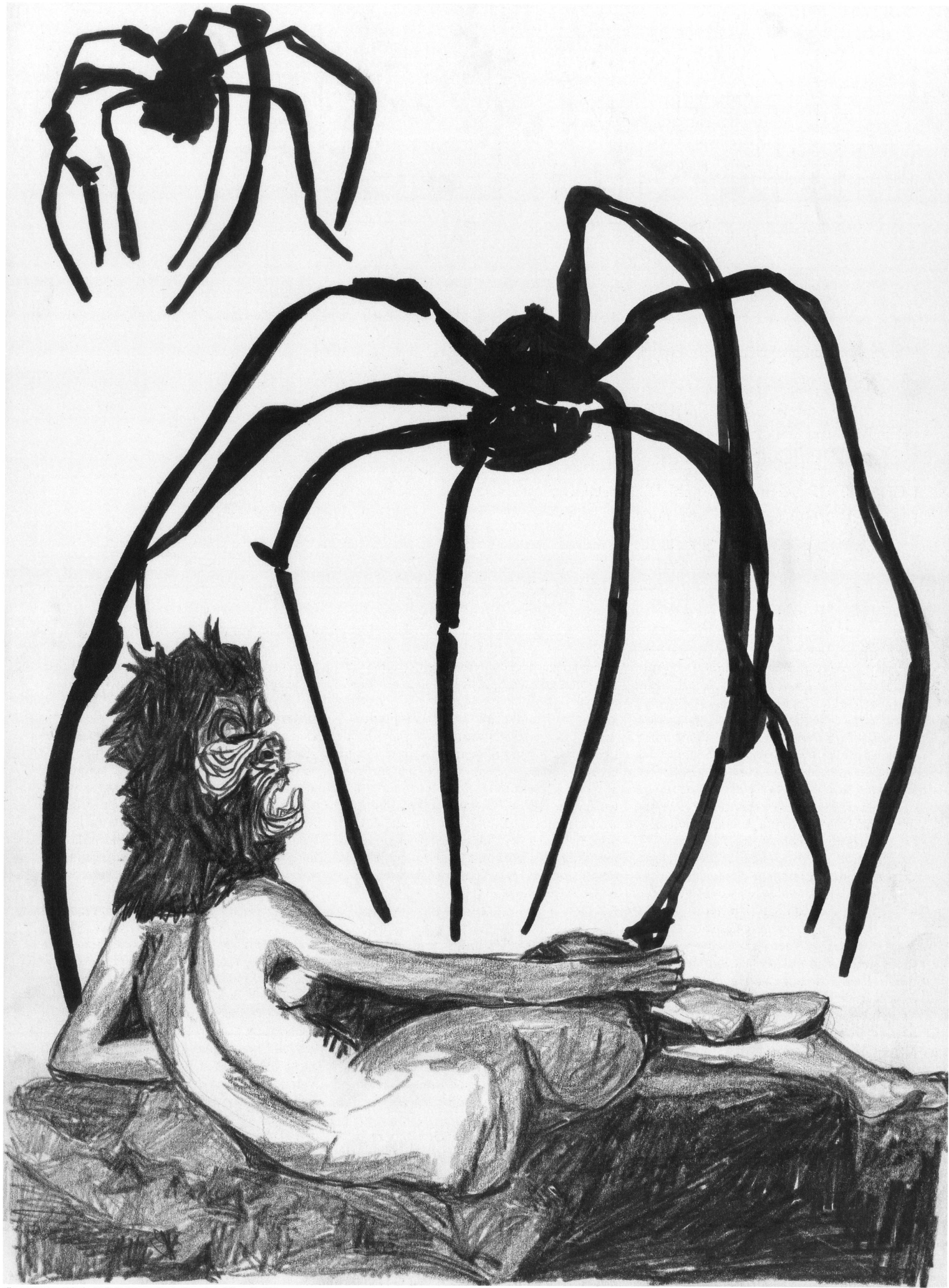
Illustration: Eva Rekae. Nach Werken von Louise Bougois und Guerrilla Girls.