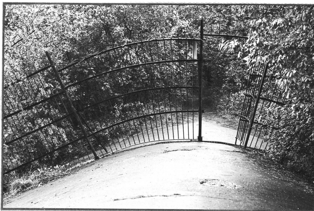
Grenzübergang Hohenems. Die Abspernung des alten Grenzübergangs in Hohenems steht immer noch. In dieser Region hat der St. Galler Polizeihauptmann Paul Grüniger in den dreissiger Jahren über 3'000 Juden die illegale Einreise und die Flucht vor den Nazis ermöglicht.