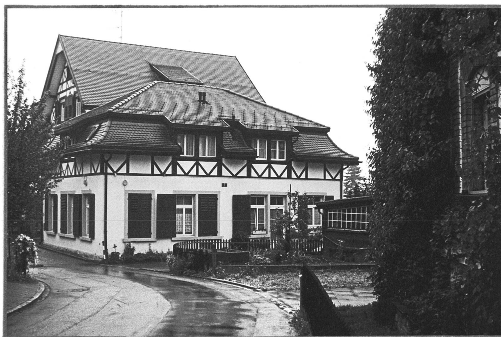
Altersheim Wienerberg. Von 1897-1974 war das heutige Altersheim an der Guisanstrasse in St. Gallen ein Mädchenheim. Als «Asyl für schutzbedürftige Mädchen» gegründet, war es über Jahre ein Ort bürgerlicher Erziehung von «gefallenen» Mädchen aus der Unterschicht.