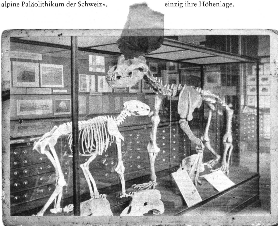
Das Wildkirchlizimmer im Heimatmuseum, mit dem rekonstruierten Skelett eines Höhlenbären, 1924.