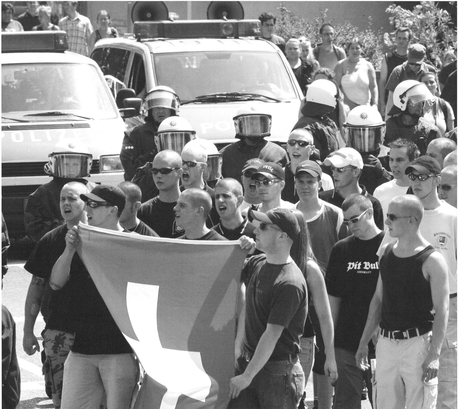
Schweizerfahne in Friedrichshafen: Die Mobilisierung der Kameraden rund um den Bodensee nimmt zu.