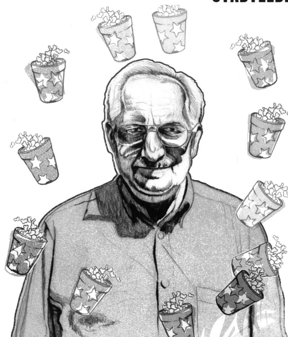
Illustration: Rahel Eisenring

Selbstverständlich ist auch dieser Vorwurf unfair, weil das eine Beispiel die Vielfalt des Tagblatts ausser Acht lässt, die vielleicht gar der liberalen Grundhaltung seines Chefredaktors zu danken ist. Denn auch wenn man nicht sagen kann, dass Herr Höpli Zweifel aufkommen liesse über seine eigene Haltung, die den schlauen Berlusconi hochleben lässt und sich an den Linken belustigt, so herrscht doch daneben offensichtlich ein publizistisches Klima, in dem auch die eigenen JournalistInnen hin und wieder dezidiert andere Analysen und Positionen vertreten können. Kann man also überhaupt etwas vorwerfen? Man kann nicht. Man läuft mit einer solchen Kritik natürlich am Anspruch des Tagblatts vorbei, der ein anderer ist. Aber man kann feststellen, dass die gutväterliche Wohlgesinnung jene trifft, die sie nicht wollen, sondern den Disput: die Jungen und die Linken. Und auf die nicht angewendet wird, von denen die Redaktion annimmt, dass sie sie nicht wollen: die Unternehmer und das Establishment.