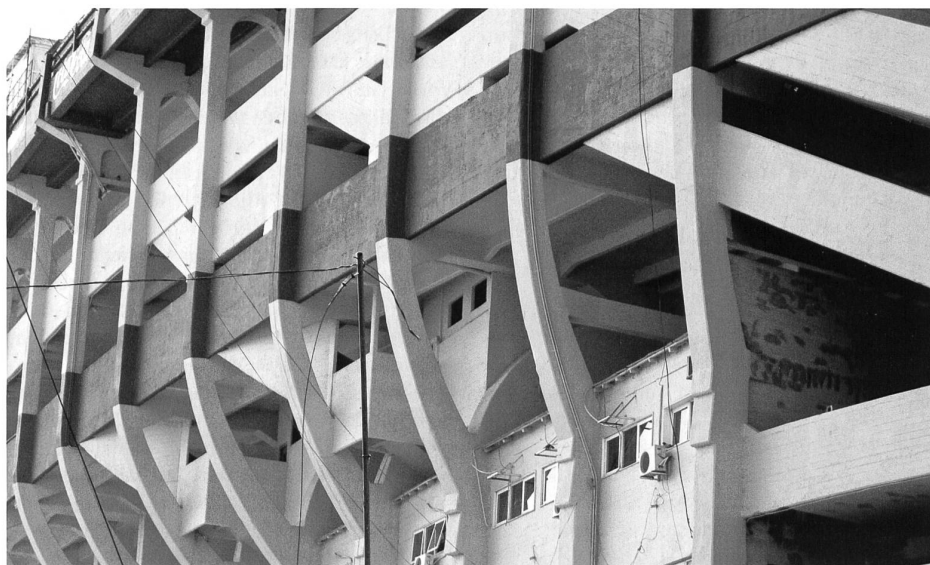
La Bombonera, Stadion der Boca Juniors und Burg von «La Doce», den wahnsinnigen Fans.