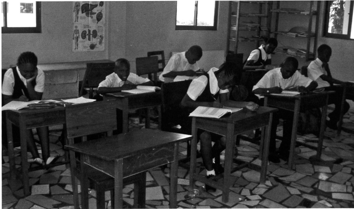
An der Privatschule Queen's International sind die Klassen überschaubar.