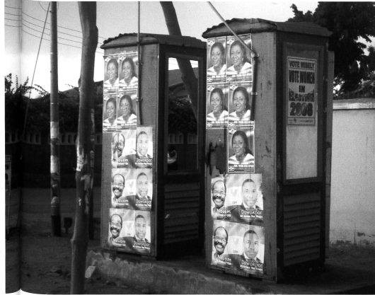
Wahlkampfpakete in Ghana: alle versprechen eine rosige Zukunft.