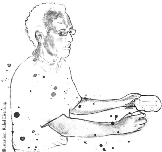
Illustration: Rahel Eisenring

Noch heute passiert es ihm, dass er auf der Strasse von ehemaligen Kunden gegrüsst wird, und sogar am Openair St.Gallen haben ihn einige Jugendliche darauf angesprochen. «Ich glaube, so etwas wird man nicht so schnell wieder los», schmunzelt er. Kathrin Haselbach