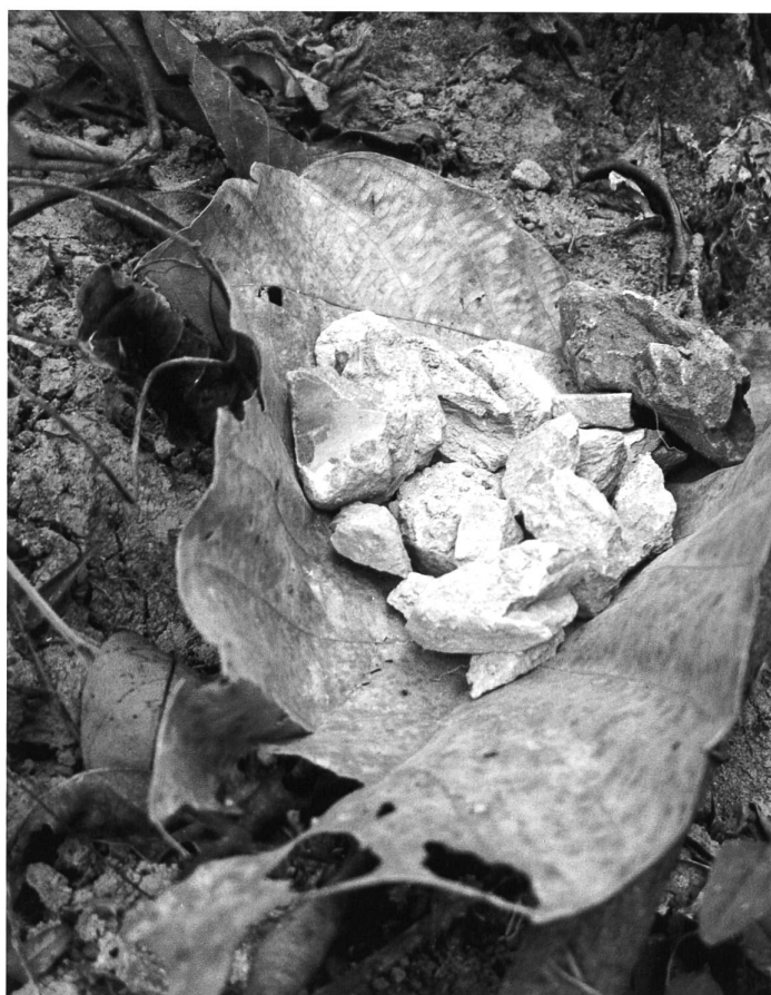
Essbare Steine mit halluzigener Wirkung.