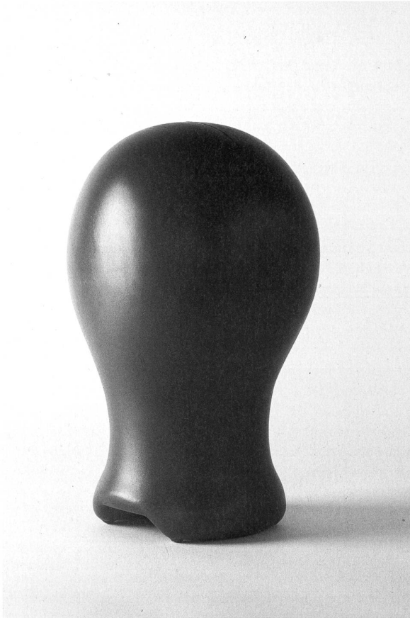
Perückenkopf, 1996 roter Kunststoff mit Öffnung, 570 mm Umfang unbekannt, Bruno