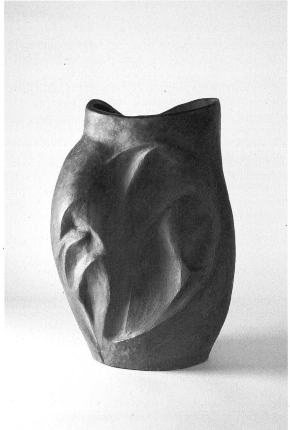
Blumenvase, 1984 gebrannter Ton, 540 mm unbekannt, Neue Kunstwerte Bruggen