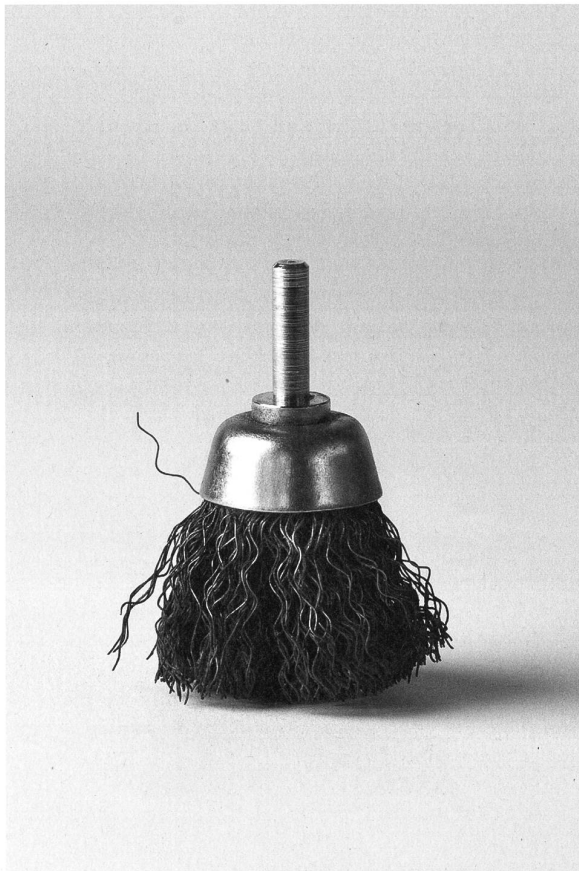
Schleifkopf "Bürste", 2001 verschiedene Metalle, 70 mm unbekannt, Saiten