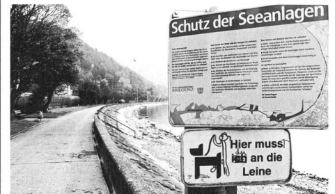
Die ehemalige Pipeline am Bodenseeufer.

Einen richtigen Radweg gibt es dem See entlang, als Teil des Bodenseeradwegs. Ungefähr an der ehemaligen Grenze zu Deutschland weist ein Schild darauf hin, dass das Gebiet einer radfahrfreundlichen Gemeinde beginne, und von da an tut man gut daran, die Augen aufzusperren. Der betonierte Weg auf der ehemaligen Pipeline zwischen der hangseitigen Bahnlinie und einem seeseitigen Mäuerchen hat es in der warmen Jahreszeit in sich: Hier ist Badestrand und es wimmelt von Fussgängerinnen und Radfahrern. Wobei ein Radfahrstreifen nicht einmal symbolisch auf den Boden gemalt ist, sondern die Radler mehr oder weniger wild durch die sich verschieden schnell bewegenden Gruppen und Grüppchen kurven.