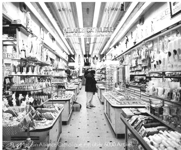
Das Magazin Alliance Catholique mit über 4000 Artikeln.