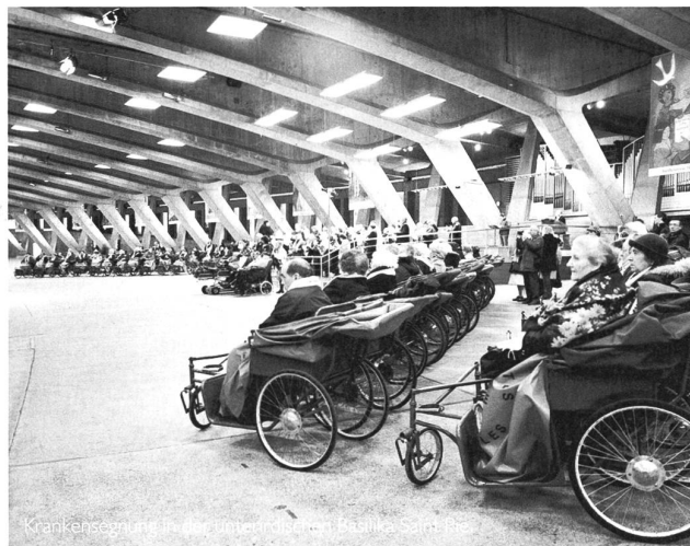
Krankensignale in der unterirdischen Basilika Saint Pie.

lee, Halleee-lujaaa», singt er vor. Bedächtiger raunen es die Gläubigen nach. Nach drei Mal wechselt der Text, die Melodie bleibt: «Aveee, Aveee, Aveee Mariiii-aaa.» Manchmal hält der Vorsinger der jungen Frau neben ihm das Mikrofon vor den Mund, sie lächelt scheu und singt ihm nach: «Aveee, aveee, aveee Mariiii-aaa.»