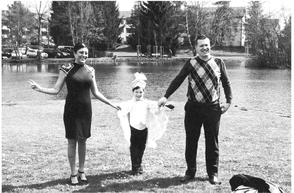
Ideal, um Feste zu feiern: der Schützenweiher.

Nachts war ich nie da. Wer die Homepage des Dancings anklickt, wirds vermutlich nachvollziehen. Ich kenne aber viele, die früher da waren. Wer in den Gemeinden östlich von Winterthur aufgewachsen ist und als Teenager erstmals in den Ausgang durfte, blieb gerne erstmal im Schützenhaus hängen. Dies war im Kraffteld beim einen oder anderen auch der Fall. Der ganze Ort wirkt irgendwie leicht aus der Zeit gefallen. Oder zumindest passt der Ort nicht so recht in mein Bild eines urbanen und grossstädtischen Winterthurs. Was mich aber noch viel mehr erstaunt: Der Schützenweiher wird vor allem von der ausländischen Bevölkerung besucht. Obwohl Winterthur nur an we-