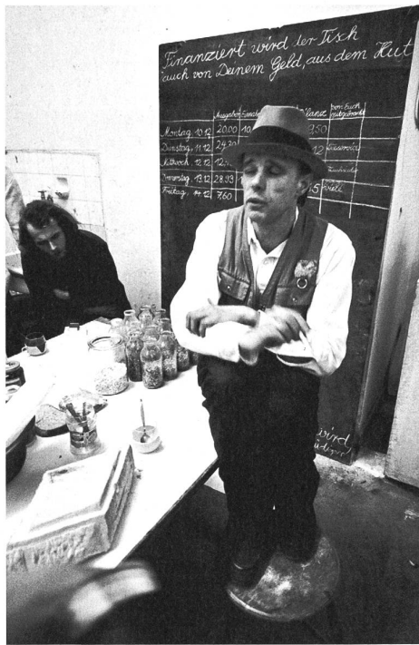
In Schaffhausen wird um Joseph Beuys gestritten.

Seit 2005 sehen sich die Hallen für neue Kunst auch vermehrt mit Angriffen aus der Po-