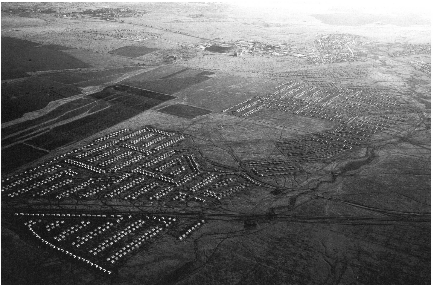
Familienquartier der Minenarbeiter in Rustenburg.

ist Historiker und war Aktivist der Anti-Apartheid-Bewegung in St.Gallen.