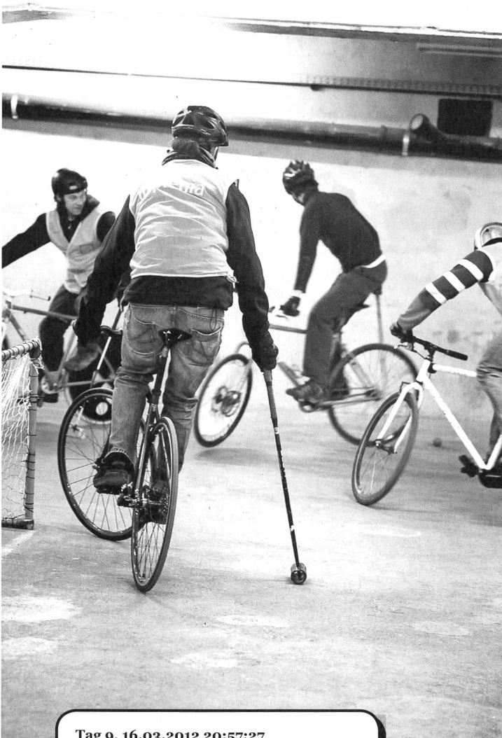
Tag 9, 16.03.2012 20:57:27 Venzone, Km 365, schön und windig, 15 Grad. Der schönste und aufregendste Teil des Alpe-Adria-Radweges. Stockdunkle Tunneln mit Eisflächen und unerwartete Baustellen ohne Durchkommen. Sturzfrei im 1976 geschüttelten Friaul angekommen.