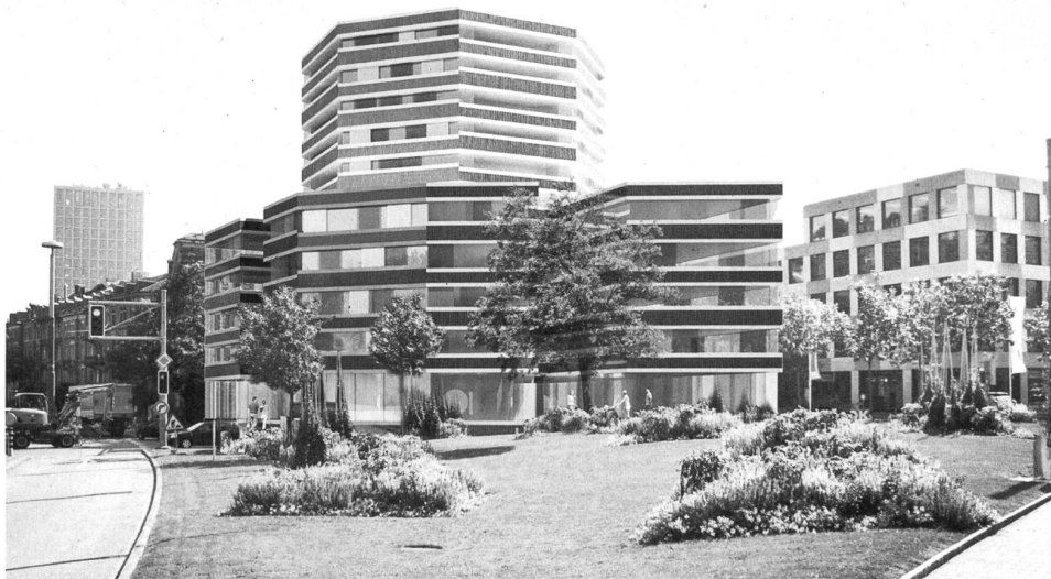
Ginge es nach den Architekten Burkhalter Sumi, würde auch noch der nicht minder hübsche Bruder vom Leoparden (rechts im Bild) nach St. Gallen ziehen. Bild: Burkhalter Sumi