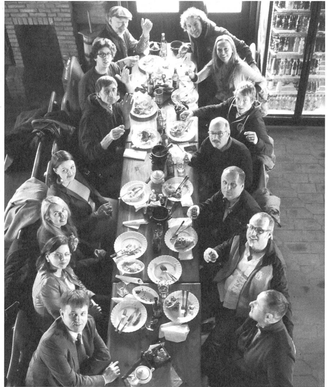
Die St.Galler Band super8 tourt durch Polen und wird ab und zu Kaffee und Kuchen eingeladen.