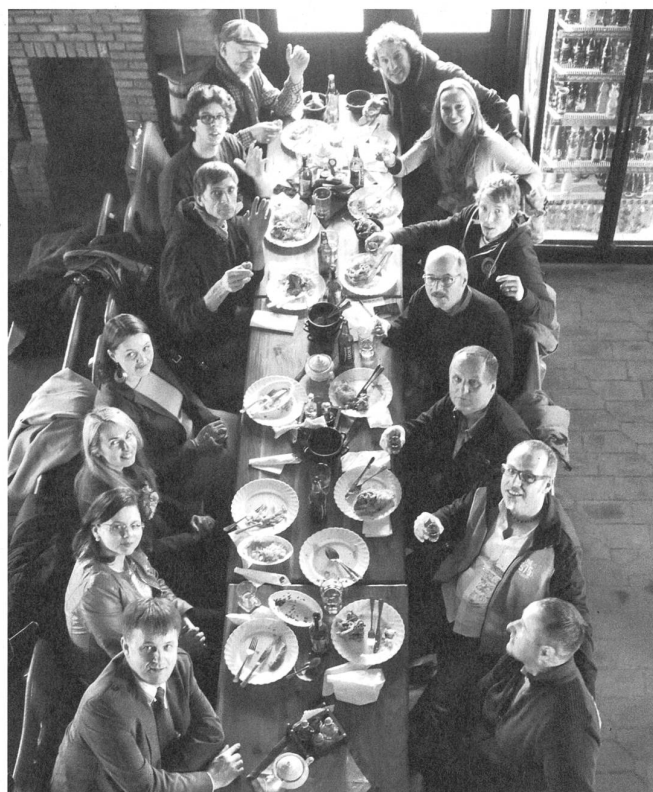
Die St.Galler Band super8 tourt durch Polen und wird ab und zu Kaffee und Kuchen eingeladen.