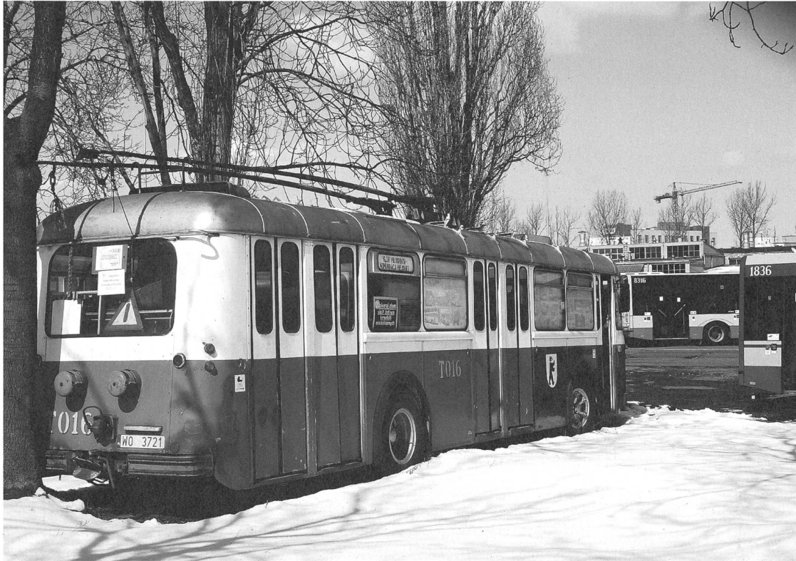
Ein alter St.Galler Bus wurde kürzlich zurück nach Hause geholt – dieser hier ist weiterhin in Warschau im Einsatz.

Anhänger. Ehrliche Heimwehgefühle flammen auf. Das zweite Konzert im Jazzarium wird von der Feuerwehr abgebrochen. Der hochsensible Feuermelder will keine Zugabe zulassen; der Club ist überhitzt.