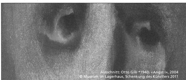
Ausschnitt: Otto Gilli *1940, «Angst I», 2004 © Museum im Lagerhaus, Schenkung des Künstlers 2011

www.fhsg.ch FHO Fachhochschule Ostschweiz