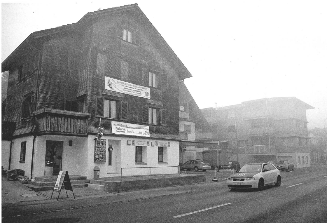
Kebab und Pizza: «Üs gfallt's z' Marpa».

Wenn sich die Welt verändert, gehen Menschen auf die Strasse – wenn sich mein Dorf verändert, gibt es einen neuen Eintrag im Handelsregister. Marbach SG, 2062 Einwohner, jeder fünfte im Turnverein, Üs gfallt's z' Marpa . Im Riet stehen die neuen Einfamilienhäuser, am Stammtisch der «Krone» sitzen die Gemeinderäte der letzten dreissig Jahre. Hier könnte der nächste Heimatfilm mit Mathias Gnädinger in der Hauptrolle spielen.