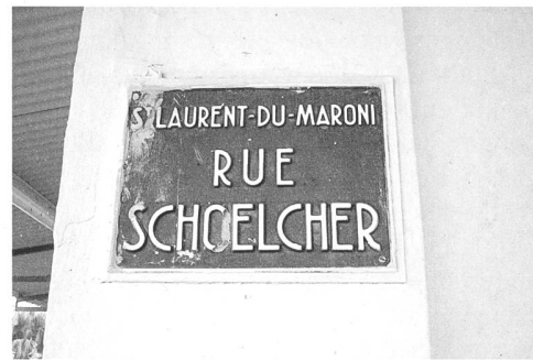
Geboren in Fessenheim im Elsass, seit 1949 im Panthéon in Paris: Sklavereiabschaffer Victor Schoelcher.

Im 19. Jahrhundert kamen zum mörderischen Klima noch Tropenkrankheiten wie Malaria und Gelbfieber hinzu. Kein Wunder, dass die Franzosen hier in Saint-Laurent ein Straflager errichteten, in dem Kriminelle und politische Gegner gewissermassen lebendig begraben wurden. Auf der Führung durch das «camp de transportation» zeigt man uns die Zelle 47, wo Henri Charrière untergebracht war. Er wurde 1970 mit seinem Roman Papillon berühmt, in dem er seine Flucht von der Île du Diable schildert (auf der auch Alfred Dreyfus inhaftiert war).