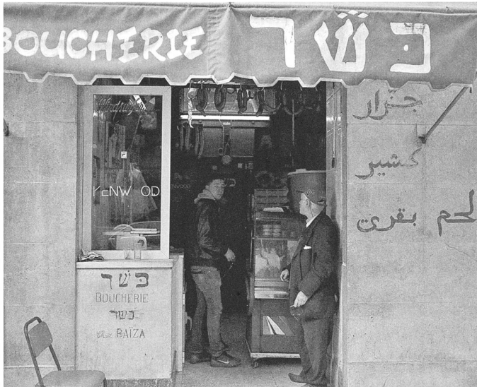
«Koscher», einmal auf Arabisch, einmal auf Hebräisch: Die jüdische Metzgerei an der Avenue de la Liberté im Stadtzentrum von Tunis.