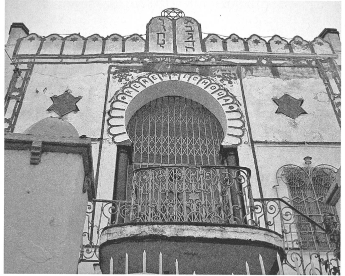
Das Tor bleibt zu, weil der Minjan, das geforderte Quorum von zehn Betenden, in der Synagoge Keren Yéchouah nicht erreicht wird.

Der Eingang ist kaum zu finden, obwohl mir Jacob den Weg genau beschrieben hat. Die einzigen Hinweise: Drei Poller versperren die Weiterfahrt und an der Ecke steht ein rotweiss gestrichenes Wachhäuschen, in dem ein gelangweilter Polizist sitzt. Im Raum hinter der unscheinbaren blauen Tür haben sich etwa zwanzig Männer versammelt, die Kippa auf dem Kopf, den Tallit um die Schultern. Es ist Samstagmorgen, Zeit für den wöchentlichen Gottesdienst in der Synagoge Beith Mordechaï von La Goulette, dem Hafenvorort von Tunis.