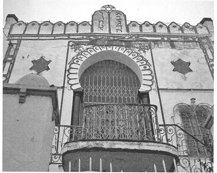
Das Tor bleibt zu, weil der Minjan, das geforderte Quorum von zehn Betenden, in der Synagoge Keren Yéchouah nicht erreicht wird.