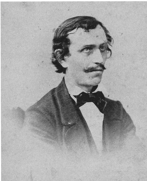
Kämpfer gegen die geistige Enge: Franz Michael Felder.